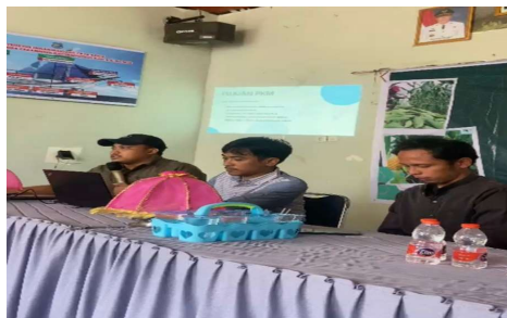
Gambar 1. Sosialisasi Program

Kegiatan pengabdian diawali dengan sosialisasi program kepada pemuda Karang Taruna Kampung Sakui-Kui. Pada tahap ini, tim pengabdian menjelaskan tujuan kegiatan, manfaat program, rencana output yang dihasilkan, serta pembagian peran antara tim dan mitra. Sosialisasi juga digunakan untuk menggali potensi dan kondisi awal masyarakat. Dari diskusi awal, diketahui bahwa sebagian besar hasil jagung masih dijual dalam bentuk mentah, sehingga harga jualnya rendah. Selain itu, belum ada kelompok usaha Karang Taruna yang aktif mengelola pengolahan hasil pertanian. Sosialisasi ini menghasilkan kesepakatan bersama untuk membentuk tim produksi jagung marning sebagai unit usaha awal Karang Taruna.