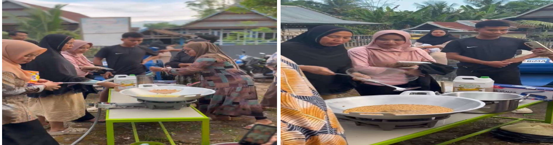
Gambar 3. Proses Pengolahan Jagung Menjadi Jagung Marning

Pelatihan teknis dilaksanakan sebagai inti kegiatan pengabdian. Pelatihan ini dilakukan secara langsung dan praktis ( learning by doing ) sehingga peserta dapat memahami seluruh proses produksi. Hasil pelatihan menunjukkan bahwa peserta mampu menghasilkan jagung marning dengan tingkat kerenyahan dan cita rasa yang lebih baik dibandingkan percobaan awal mereka.