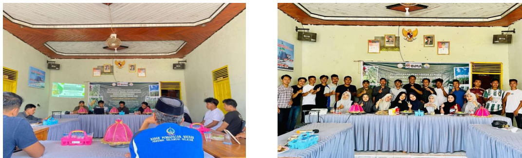
Gambar 2. Focus Group Discussion (FGD)

FGD ini menjadi dasar dalam menyusun rancangan kegiatan yang lebih tepat sasaran sesuai kebutuhan lapangan.