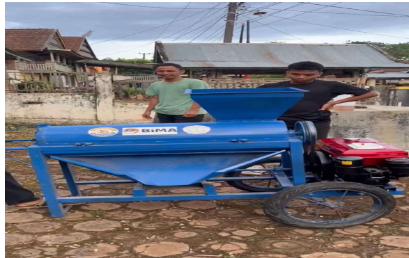
Gambar 4. Pelatihan Pengoperasian Mesin Pemipil Jagung

Setelah diberikan pelatihan penggunaan dan perawatannya, mitra mulai mampu mengoperasikan seluruh alat secara mandiri. Dampaknya, proses produksi yang sebelumnya memakan waktu lama kini menjadi lebih cepat, konsisten, dan higienis.