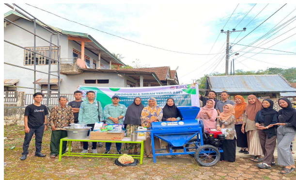
Gambar 6. Pelaksanaan Program Produksi Jagung Marning