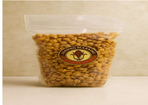
Gambar 5. Jagung Marning Rubycorn

Produksi awal ini menjadi titik awal bagi mitra untuk mengembangkan usaha rumahan berbasis jagung secara mandiri.