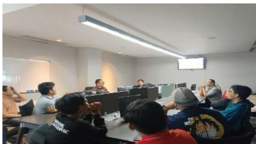
Gambar 1. Kegiatan workshop

Hasil dari workshop yang diselenggarakan menunjukkan peningkatan signifikan dalam pemahaman peserta terhadap regulasi penyiaran yang diatur dalam P3SPS. Sebelum workshop dimulai, mayoritas peserta memiliki pemahaman dasar terhadap regulasi ini, namun cenderung kurang memahami implementasi praktisnya. Setelah sesi pemaparan teori dan diskusi studi kasus, sebanyak 85% peserta menunjukkan pemahaman yang lebih baik terkait kriteria kelayakan program siaran.