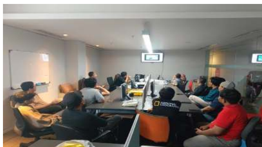
Gambar 2. Kegiatan Diskusi

Peserta juga memberikan tanggapan positif terhadap penggunaan alat bantu evaluasi yang diperkenalkan selama workshop. Alat bantu ini mencakup daftar periksa (checklist) yang dirancang khusus berdasarkan P3SPS dan standar teknis audio-visual. Penggunaan checklist ini dianggap mempermudah proses evaluasi dan memastikan bahwa seluruh aspek penting telah diperiksa secara sistematis.