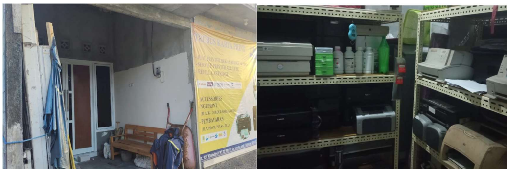
Gambar 2. Tampak Depan Usaha dan Persediaan Barang Dagangan

Selain itu Toko TKP merupakan salah satu usaha yang bergerak dalam penjualan dan servis printer (Gambar 2). Pada Toko ini pemilik mempunyai keahlian perbaikan printer, dan hal tersebutlah yang menjadi modal tersendiri untuk mendirikan usaha ini. Toko TKP memanfaatkan printer yang bagi sebagian orang sudah tidak dapat digunakan atau bisa disebut barang bekas. Pemilik Toko TKP membuat barang bekas tersebut menjadi barang yang memiliki nilai jual lebih dengan cara memperbaiki printer tersebut dan menjual kembali dalam keadaan yang normal dan bergaransi. Selain penjualan, Toko TKP juga menerima servis berbagai type printer yang mana harga servis yang dikenakan relatif lebih murah dibandingkan servis printer lainnya.