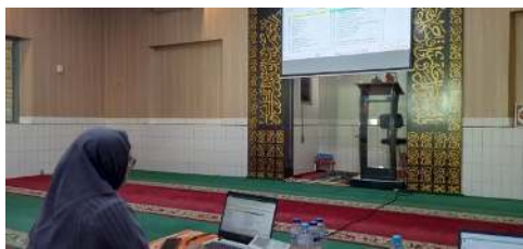
Gambar 1. Pendampingan di Masjid Al Fithrah

Pada tahap awal, peserta menerima pelatihan dasar mengenai konsep akuntansi, seperti pengelompokan aset, liabilitas, pendapatan, dan beban. Narasumber juga memperkenalkan pentingnya laporan keuangan yang transparan dan akuntabel dalam membangun kepercayaan jamaah dan donatur.