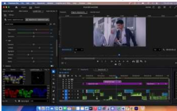
Gambar 11. Project adobe premiere film "Side" Scene 4 (2)