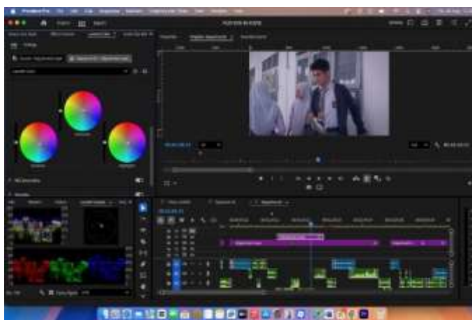
Gambar 12. Project adobe premiere film "Side" Scene 4 (3)

highlight ke -11.2, dan whites ke -8.1 Dan masuk ke Color & Wheels terlihat shadows sedikit