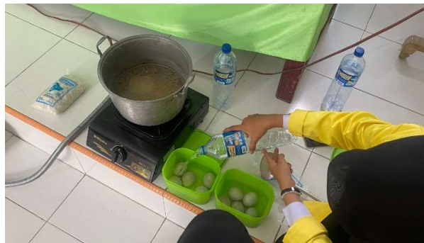
Gambar 2. Dokumentasi Proses Pembuatan Telur Asin

Produk telur asin yang dihasilkan setelah masa pemeraman memiliki kualitas yang cukup memuaskan. Kuning telur berwarna oranye kemerahan, tekstur padat, dan rasa asin yang merata. Beberapa peserta bahkan mencoba membuat variasi produk, seperti telur asin rebus siap santap, yang kemudian dikemas dalam wadah plastik untuk dijual di pasar lokal.