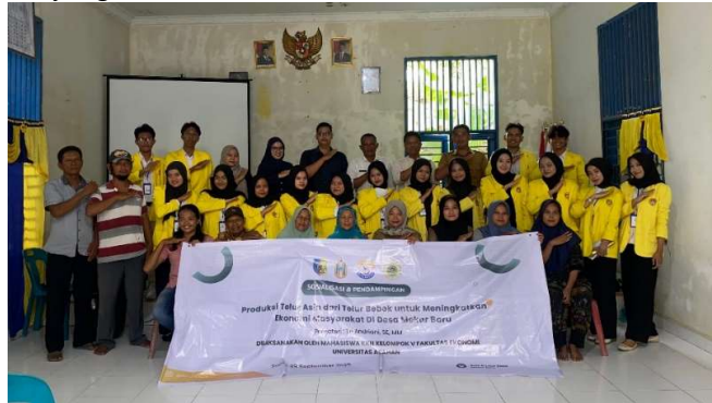
Gambar 1. Dokumentasi Pelatihan Bersama Warga Desa Mekar Baru

Dengan demikian, sosialisasi dan pendampingan produksi telur asin berbasis telur bebek di Desa Mekar Baru, Kecamatan Sei Balai, Kabupaten Batu Bara, bukan hanya sekadar kegiatan pelatihan teknis. Program ini merupakan bagian dari strategi pemberdayaan masyarakat yang bertujuan meningkatkan kesejahteraan ekonomi, memperkuat identitas desa, dan menciptakan kemandirian ekonomi berbasis potensi lokal. Melalui kegiatan ini, diharapkan Desa Mekar Baru mampu mengembangkan produk unggulan yang tidak hanya bermanfaat bagi masyarakat setempat, tetapi juga mampu bersaing di pasar yang lebih luas.