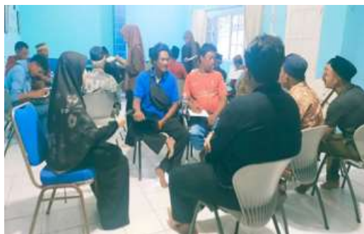
Gambar 1. Fokus Grup Diskusi