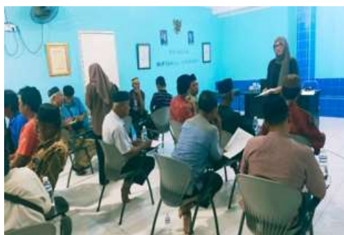
Gambar 2. Pengisian Kuesioner Nelayan