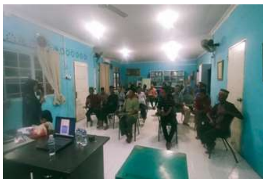
Gambar 3. Pemaparan Materi Edukasi Nelayan

Dari hasil fokus grup diskusi dihasilkan kesimpulan dan pembahasan bahwa jenis potensi bahaya dan pengendalian risiko dari lingkungan kerja nelayan serta jenis alat pelindung diri yang dimiliki dalam pekerjaan nelayan adalah sebagai berikut :