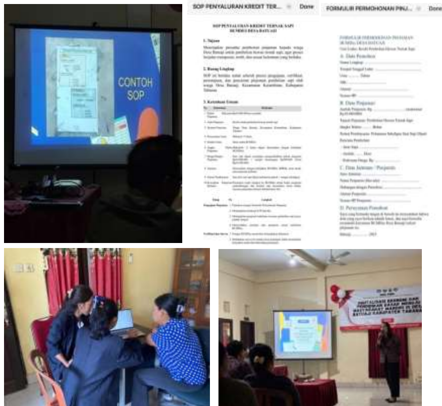
Gambar 2. Pelatihan dan pendampingan pengelolaan Manajemen Usaha dan SOP BUMDesa

Pelatihan berjalan dengan efektif namun karena keterbatasan waktu dalam pelatihan mengingat banyaknya materi yang harus disampaikan serta penerapan langsung pelaksanaan pembinaan membuat