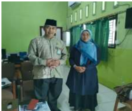
Gambar 1. Tim PKM Melakukan Koordinasi Dengan Kepala MAN 3 Kota Jambi

Tahap ini juga mencakup penyusunan materi dan instrumen evaluasi sederhana untuk mengukur tingkat pemahaman peserta terhadap materi yang diberikan. Perencanaan yang matang diperlukan agar kegiatan berjalan efektif dan sesuai dengan tujuan (Mulyasa, 2017).