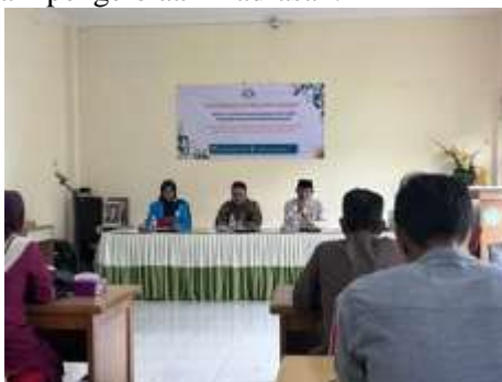
Gambar 3. Diskusi dan Tanya Jawab

Ceramah interaktif digunakan untuk memberikan pemahaman konseptual mengenai manajemen madrasah berbasis akhlakul karimah, sementara diskusi dan tanya jawab bertujuan memperdalam kasus nyata yang dihadapi peserta dalam pengelolaan madrasah.