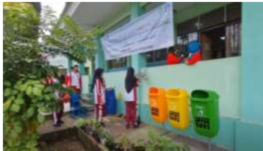
Gambar 3. Pendampingan Penggunaan Alat Press Kaleng

Untuk pengelolaan sampah Anorganik membutuhkan alat press kaleng. Dari aspek ekonomi, harga jual kaleng bekas yang sudah dipress akan lebih tinggi dibandingkan dengan harga jual kaleng utuh (Stiyono, dkk., 2022). Selisih harga diantara kedua jenis kaleng tersebut bisa mencapai 3000/kg. Hal ini menciptakan peluang untuk penambahan nilai tambah sampah. Pada kegiatan PKM ini disampaikan kepada guru dan siswa terkait penggunaan alat press kaleng dan prosedur perawatan alat. Selain itu siswa dan siswi juga disampaikan untuk membuang sampah berdasarkan jenis sampah Organik dan Anorganik pada tong sampah yang telah disediakan. Dokumentasi pelatihan penggunaan alat press kaleng dijelaskan pada gambar 3 dan pendampingan penggunaan tong sampah organik dan anorganik dijelaskan pada gambar 4 berikut ini.