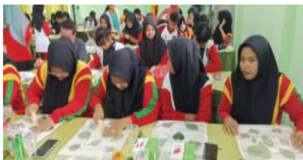
Gambar 6. Pelatihan Ecoprinting

Pengolahan limbah organik untuk menjadi produk jadi lainnya adalah pelatihan eco printing . Hal ini berdasarkan potensi yang ada di mitra, dimana terdapat 500 lebih jenis tanaman yang tersebar baik di halaman sekolah maupun di green house . Teknik eco-print adalah salah pencetakan bentuk dan warna pada media seperti pada selembar kain, keramik dan kertas dengan menggunakan zat warna dari tumbuh-tumbuhan (Nurliana, dkk., 2021). Untuk itu telah diberikan pelatihan dan pemberdayaan mitra dalam Eco Printing untuk produk-produk seperti tas goodie bag, kain dan kaos. Dokumentasi hasil kegiatan pelatihan ecoprinting dijelaskan pada gambar 6 dan 7 berikut ini.