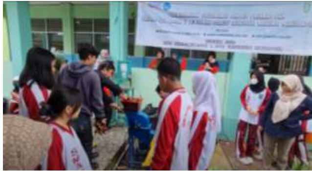
Gambar 2. Pendampingan Penggunaan Mesin Pencacah

Sampah yang bersifat organik yang dihasilkan dari halaman SMAN 3 Pontianak berupa daun-daun yang berguguran membutuhkan mesin penghancur atau pencacah sampah. Sampah organik ini dapat dimanfaatkan sebagai bahan baku kompos. Proses pencacahan sampah menjadi ukuran yang lebih kecil dapat membantu mempercepat proses pengomposan. Sehingga dibutuhkan penerapan TTG mesin yang mampu menghancurkan atau mencacah sampah organik (Nugraha, dkk., 2019). Adapun tahapan rancang bangun mesin pencacah terdiri dari komponen: rangka, pisau, poros, pisau putar, casing hopper, motor penggerak listrik serta transmisi (Batubara, dkk., 2022). Penerapan TTG mesin pencacah sampah organik ini dilakukan dengan cara pendampingan penggunaan mesin pencacah dan cara perawatannya bagi guru dan siswa kader Adiwiyata. Pelatihan dan pendampingan pengolahan sampah organik didokumentasi pada gambar 2 berikut ini.