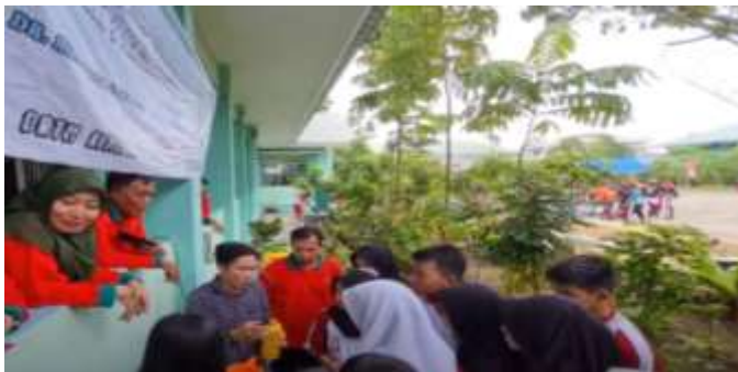
Gambar 5. Pelatihan Komposting

Pada pelaksanaan kegiatan PKM ini menggunakan teknik komposting jenis kompos aerob dimana alat komposter menggunakan drum dengan adanya sirkulasi udara dan penambahan starter berupa EM4 untuk mempercepat proses komposting selama kurang lebih 3-4 minggu. Keuntungan dari komposter ini adalah prosesnya relatif cepat, tidak berbau dan mampu menghasilkan kompos padat serta kompos cair (Kadaria, Ulli.; Sulastri, 2022). Pelatihan dan pendampingan pembuatan kompos dijelaskan pada dokumentasi gambar 5 berikut ini.