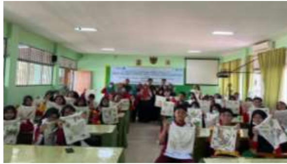
Gambar 7. Hasil Pelatihan Ecoprinting