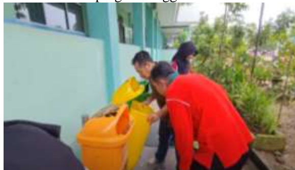
Gambar 4. Pendampingan Penggunaan Tong Sampah Organik dan Anorganik