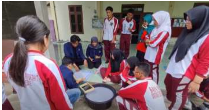
Gambar 8. Pelatihan Daur Ulang Kertas

Pengolahan limbah Anorganik menjadi produk jadi misal kertas dan plastik. Untuk itu akan diberikan pelatihan pemanfaatan kertas bekas untuk dapat menjadi bahan baku produk daur ulang misal kalender. Sehingga kertas bekas yang dihasilkan siswa sekolah dapat dimanfaatkan secara baik dan memiliki sifat ekonomi. Kegiatan ini akan juga akan memberikan manfaat bagi siswa sekolah SMAN 3 Pontianak untuk terus mengembangkan dan mengolah sampah yang dihasilkan sekolah sehingga dapat menumbuhkan jiwa kewirausahaan bagi siswa. Dokumentasi pelatihan daur ulang kertas dijelaskan pada gambar 8 berikut ini.