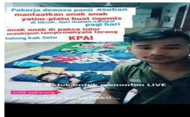
Gambar 2. Begging Digital dilakukan di Panti Asuhan

Fenomena Begging Digital kembali menjadi sorotan, kali ini terkait dengan sebuah kasus yang terjadi di salah satu panti asuhan. Dalam kasus tersebut, pihak panti asuhan diduga melakukan tindakan eksploitasi terhadap anak-anak asuhnya dengan memanfaatkan mereka sebagai objek dalam siaran langsung ( live streaming ) di platform TikTok. Konten yang disajikan dalam siaran langsung tersebut memperlihatkan keseharian anak-anak yang mana menarik perhatian penonton dan mendorong mereka untuk memberikan hadiah virtual ( gift ), yang kemudian dapat dikonversi menjadi uang. Tindakan ini menuai kecaman dari berbagai pihak karena dianggap sebagai bentuk eksploitasi anak demi keuntungan finansial.