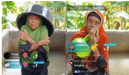
Gambar 1. Trend Siram Air di Tiktok

Fenomena Begging Digital merujuk pada kebiasaan individu meminta sejumlah uang atau dukungan finansial dari orang lain melalui platform digital, seperti media sosial, situs web, atau aplikasi. Praktik ini lahir sebagai konsekuensi dari adanya berbagai platform media sosial yang berkembang. Dulu, media massa menghilangkan interaksi dengan audiens, namun kini para komunikator dapat langsung berkomunikasi dan bereaksi. Terdapat berbagai jenis Begging Digital yang muncul. Konten Begging Digital yang dilakukan adalah mandi lumpur, menjual keadaan yang menyedihkan menjadi sebuah budaya populer di kalangan masyarakat. Hal ini menjadi tren dan banyak menarik perhatian masyarakat. Aksi ini banyak mendapatkan perhatian penonton atau viewers yang menonton aksi live mandi lumpur dan memberikan gift terhadap aksi tersebut sehingga mereka para konten kreator. Hal ini menjadikan aksi tersebut menjadi budaya populer sehingga ini dianggap biasa dan viral sehingga mereka akan melakukan terus menerus demi meraup keuntungan yang besar.