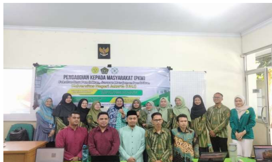
Gambar 1. Dokumentasi/Gambar ini menunjukkan kegiatan Pengabdian Kepada Masyarakat (PKM) dari Fakultas Ilmu Pendidikan, Universitas Negeri Jakarta, dalam mendigitalisasi manajemen sekolah untuk guru SD di Kabupaten Karawang.

Secara keseluruhan, hasil post-test dan umpan balik kualitatif menunjukkan bahwa program literasi digital ini berhasil dalam meningkatkan pemahaman dan keterampilan guru Madrasah Ibtidaiyah di Kecamatan Klari dalam pengembangan media ajar. Meskipun demikian, ada ruang untuk perbaikan, terutama dalam aspek keamanan digital dan durasi pelatihan, untuk memaksimalkan dampak program di masa mendatang. Temuan ini sejalan dengan penelitian sebelumnya yang menunjukkan bahwa pelatihan literasi digital yang terstruktur dapat secara signifikan meningkatkan kompetensi guru dalam pemanfaatan teknologi untuk pembelajaran pendahuluan.