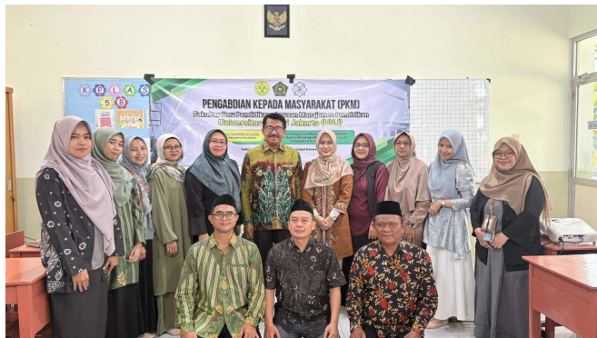
Gambar 1. Dokumentasi/Gambar ini menunjukkan kegiatan Pengabdian Kepada Masyarakat (PKM) dari Fakultas Ilmu Pendidikan, Universitas Negeri Jakarta, dalam penguatan Peran Manajerial Kepala Sekolah dalam Meningkatkan Kinerja Guru di Kabupaten Karawang.

Dengan demikian, hasil post-test dan kajian literatur secara bersamaan membuktikan bahwa penguatan kompetensi manajerial kepala sekolah dapat meningkatkan kinerja guru, serta mendukung transformasi pendidikan di sekolah dasar swasta di Kabupaten Karawang.