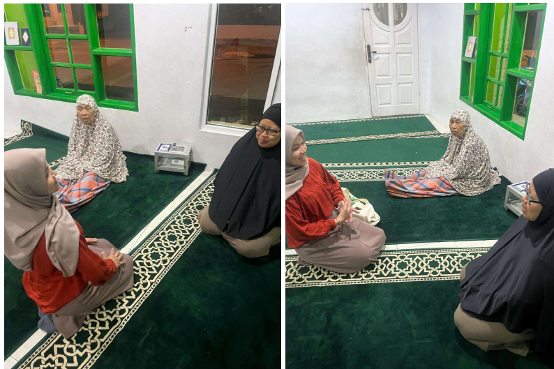
Gambar 1. Dokumentasi Wawancara