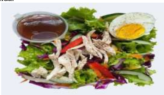
Gambar 2. Produk Ning's kitchen Garden Salad

Salad yang dikembangkan terdiri atas sayur-sayuran segar seperti selada, kol ungu, tomat ceri, dan tambahan daun herbal seperti daun mint, daun kemangi, dan daun pegagan. Dressing salad dibuat dari bahan alami seperti minyak zaitun, perasan jeruk nipis, madu, dan sedikit rempah seperti jahe parut. Manfaat sebagai, detoksifikasi alami tubuh, meningkatkan daya tahan tubuh dan sumber serat dan vitamin dari pekarangan rumah. Nilai tambah dari salad ini adalah kesegarannya dan bahan herbal yang ditanam sendiri tanpa pestisida.