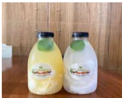
Gambar 3. Produk Ning's Kitchen Garden Smoothies

Smoothies dibuat dari kombinasi buah lokal dan daun herbal kale, daun seledri, apel hijau, alpukat dan daun mint. Contoh resepnya yaitu smoothies green alkaline . Produk ini sangat cocok untuk kalangan anak muda yang gemar minuman sehat dan praktis, sekaligus mengedukasi masyarakat mengenai konsumsi herbal dalam bentuk yang lebih modern dan mudah diterima. Manfaat sebagai, meningkatkan energi harian secara alami, kaya antioksidan dan antiinflamasi menunjang kesehatan kulit dan metabolisme tubuh.