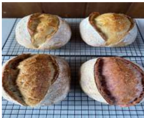
Gambar 1. Produk Ning's Kitchen Garden Sourdough

Salad yang dikembangkan terdiri atas sayur-sayuran segar seperti selada, kol ungu, tomat ceri, dan tambahan daun herbal seperti daun mint, daun kemangi, dan daun pegagan. Dressing salad dibuat dari bahan alami seperti minyak zaitun, perasan jeruk nipis, madu, dan sedikit rempah seperti jahe parut. Manfaat sebagai, detoksifikasi alami tubuh, meningkatkan daya tahan tubuh dan sumber serat dan vitamin dari pekarangan rumah. Nilai tambah dari salad ini adalah kesegarannya dan bahan herbal yang ditanam sendiri tanpa pestisida.