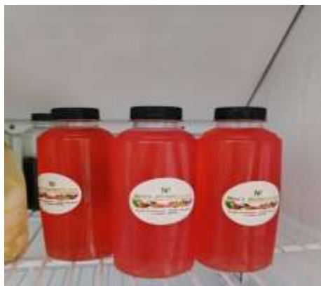
Gambar 4. Produk Ning's Kitchen Garden Jamu Modern

Ning's Kitchen Garden merupakan salah satu bentuk implementasi kegiatan ekonomi kreatif dari pemanfaatan tanaman obat keluarga. Ekonomi kreatif merupakan kegiatan ekonomi yang berfokus pada penciptaan nilai tambah berbasis ide, kreativitas, dan inovasi manusia dalam mengelola sumber daya yang ada (Kementerian Pariwisata dan Ekonomi Kreatif Republik Indonesia, 2021). Ning's Kitchen Garden menjadi contoh inspiratif karena mampu mengubah aktivitas bercocok tanam sederhana menjadi kegiatan produktif yang bernilai ekonomi. Melalui pendekatan ekonomi kreatif, masyarakat didorong untuk berpikir inovatif dalam mengelola sumber daya lokal, sehingga kegiatan yang awalnya bersifat konsumtif dapat bertransformasi menjadi usaha yang memberikan nilai tambah dan berdampak pada peningkatan kesejahteraan.