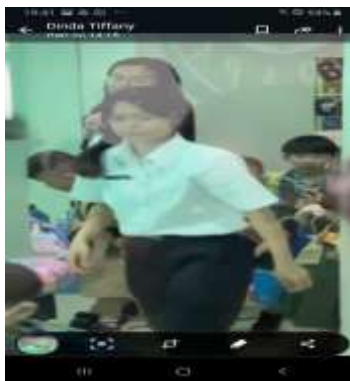
Nampak salah seorang anak menghampiri orangtuanya minta untuk dipeluk karena