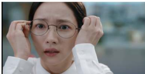
Gambar 3. Ji-won secara mendadak tersadar sedang berada di Kantor setelah mengetahui dirinya telah meninggal dunia (Episode 1, Waktu: 24:47)

won untuk mengubah nasibnya. Kekosongan yang ditinggalkan oleh hidupnya yang lama tidak diisi dengan hal yang sama menyedihkannya. Sebaliknya, dia kini bisa membentuk kehidupan baru, dimana dia memegang kendali penuh atas takdirnya, dan bukan lagi menjadi korban.