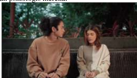
Gambar 7. Scene 15 Film “Dalam Bayang”

Dari sisi komposisi dan blocking, film ini menonjolkan pengaturan ruang yang organik dan tidak kaku. Aktor diberi ruang untuk bergerak mengikuti kebutuhan situasi, bukan sekadar mengikuti pola kamera. Teknik medium shot dan close-up digunakan untuk memperlihatkan kedekatan emosional, sedangkan long shot menegaskan jarak dan kesunyian batin tokoh. Blocking antar karakter disusun untuk mencerminkan hubungan psikologis mereka.