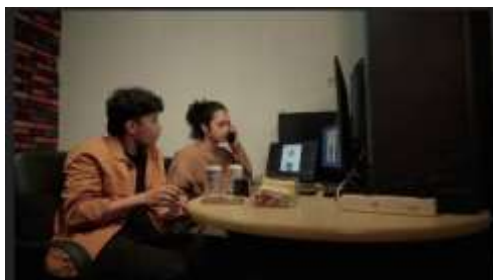
Gambar 2. Scene 14 Film “Dalam Bayang”

Pada Scene 14, ditampilkan ruang kerja berupa studio editing. Elemen visual seperti monitor ganda, meja yang dipenuhi makanan ringan, serta pencahayaan redup menunjukkan suasana kerja yang santai namun tetap intens. Dinding bermotif bata warna-warni menambah karakter visual khas ruang produksi kreatif. Setting ini menggambarkan dunia keseharian mahasiswa seni yang penuh ide dan aktivitas, serta memperlihatkan kesungguhan tokoh dalam proses kreatifnya. Penataan ruang yang sederhana tetapi detail menegaskan pendekatan realisme yang digunakan.