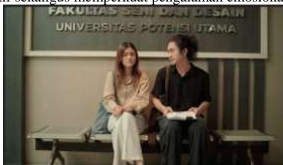
Gambar IV.29. Scene 29 Film “Dalam Bayang”

Estetika visual menjadi elemen yang menyatukan seluruh aspek mise-en-scène . Warna, cahaya, dan ruang dikomposisikan secara harmonis untuk menciptakan suasana melankolis dan reflektif. Dominasi warna lembut serta ruang negatif yang lapang digunakan untuk menandai kesepian tokoh dan kehampaan emosional yang ia rasakan. Setiap frame dirancang bukan hanya untuk memperindah tampilan, tetapi juga menyampaikan makna simbolik di balik tindakan dan diamnya karakter. Dengan demikian, estetika visual dalam “Dalam Bayang” berfungsi sebagai bahasa sinematik yang memperdalam makna naratif sekaligus memperkuat pengalaman emosional penonton.