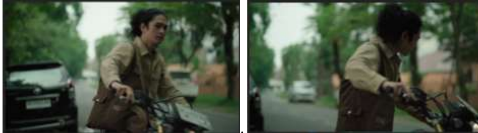
Gambar 8. Pergerakan Kamera pada Scene 17 Film “Dalam Bayang”

Pergerakan kamera memperkuat pendekatan realisme dengan menggunakan teknik handheld untuk menghadirkan kesan spontan dan keintiman. Kamera mengikuti pergerakan aktor secara lembut tanpa banyak pemotongan, seolah penonton ikut menyaksikan peristiwa secara langsung. Dalam beberapa adegan reflektif, digunakan long take untuk menjaga kontinuitas waktu dan memberi ruang bagi penonton merasakan intensitas emosi karakter tanpa gangguan transisi gambar. Pendekatan ini membuat film terasa personal, seakan penonton diajak masuk ke ruang batin tokoh.