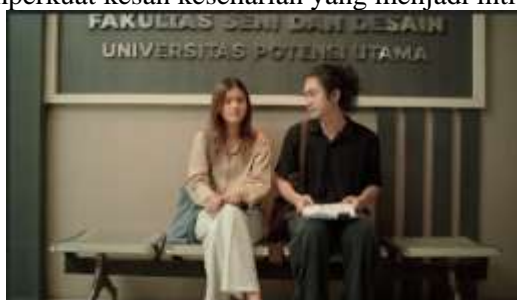
Gambar 1. Scene 29 Film "Dalam Bayang"

Latar atau setting dipilih dari ruang-ruang yang dekat dengan realitas kehidupan mahasiswa, Seperti kampus pada scene 29, studio editing pada scene 14 dan kafe pada scene 7. Lokasi tersebut tidak mengalami banyak modifikasi, melainkan dibiarkan tampil sebagaimana adanya untuk mempertahankan kesan autentik. Setiap ruang dalam film bukan hanya berfungsi sebagai tempat terjadinya peristiwa, tetapi juga sebagai pendukung aspek rekonstruksi realitas yang ingin dicapai dalam film. Tata ruang dan properti yang minimalis memperkuat kesan keseharian yang menjadi inti pendekatan realistik.