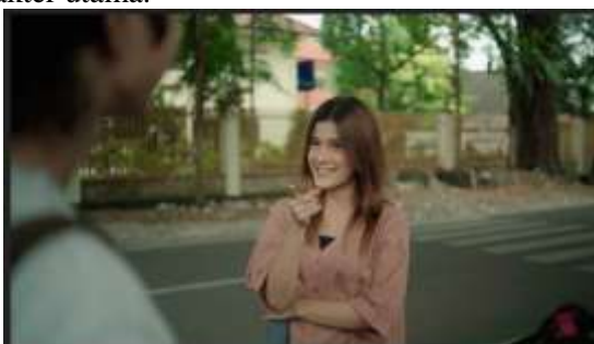
Gambar 4. Scene 13 Film “Dalam Bayang”

Pencahayaan berperan penting dalam membentuk atmosfer emosional film. Sebagian besar adegan menggunakan cahaya alami dari sumber yang ada di lokasi, seperti sinar matahari dan lampu ruangan, untuk menciptakan kesan realistis. Pada adegan yang menampilkan kedekatan dan kehangatan antar tokoh, digunakan pencahayaan lembut dengan tone hangat. Sebaliknya, adegan yang sarat konflik batin memanfaatkan low-key lighting untuk membangun suasana melankolis. Teknik pencahayaan ini tidak hanya berfungsi secara teknis, tetapi juga simbolis dengan mewakili perubahan suasana hati dan dinamika hubungan dua karakter utama.