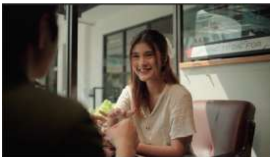
Gambar 10 Scene 30 Film “Dalam Bayang”

Pada Scene 30, sutradara mengarahkan aktris untuk menampilkan ekspresi hangat dan natural yang menggambarkan keintiman dan penerimaan. Tatapan mata yang lembut dan senyum yang tulus menjadi penanda kedekatan emosional antara dua karakter. Gestur tangan terbuka dan suasana pencahayaan alami membantu memperkuat nuansa nyaman serta ketulusan interaksi. Melalui pendekatan ini, emosi yang dihasilkan tampak jujur, ringan, dan menyentuh penonton secara empatik.