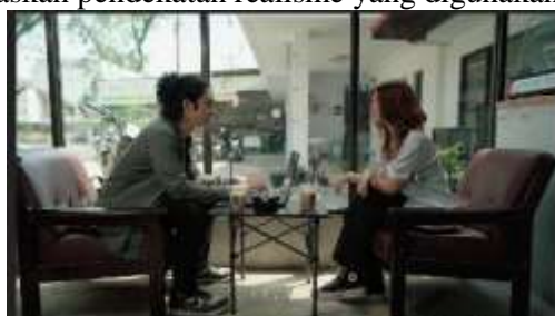
Gambar 3. Scene 7 Film “Dalam Bayang”

Pada Scene 14, ditampilkan ruang kerja berupa studio editing. Elemen visual seperti monitor ganda, meja yang dipenuhi makanan ringan, serta pencahayaan redup menunjukkan suasana kerja yang santai namun tetap intens. Dinding bermotif bata warna-warni menambah karakter visual khas ruang produksi kreatif. Setting ini menggambarkan dunia keseharian mahasiswa seni yang penuh ide dan aktivitas, serta memperlihatkan kesungguhan tokoh dalam proses kreatifnya. Penataan ruang yang sederhana tetapi detail menegaskan pendekatan realisme yang digunakan.