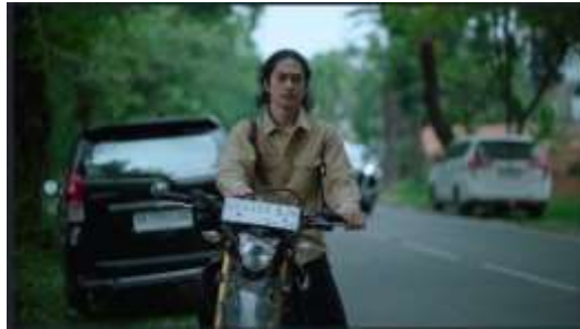
Gambar IV.9. Scene 23 Film “Dalam Bayang”

Pada Scene 13, digunakan pencahayaan alami dari sinar matahari. Adegan ini dilakukan di luar ruangan pada siang hari dengan cahaya yang lembut dan merata. Bayangan halus pada wajah tokoh perempuan memperkuat kesan realistis dan menambah keintiman interaksi antar karakter. Penggunaan cahaya alami membuat visual tampak jujur dan tidak dibuat-buat, sejalan dengan konsep realisme yang diusung film.