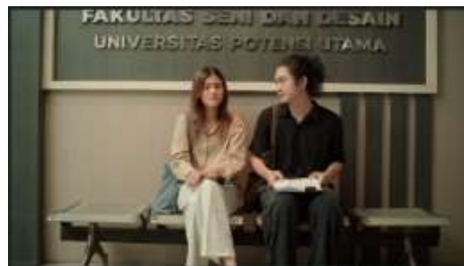
Gambar 5. Scene 29 Film “Dalam Bayang”

Pemilihan kostum dan tata rias dalam film “Dalam Bayang” menjadi salah satu unsur penting dalam mendukung karakterisasi dan suasana realistis yang ingin dihadirkan. Sutradara melakukan riset terhadap jenis pakaian, warna, dan gaya yang mencerminkan kehidupan mahasiswa seni serta kondisi sosial di lingkungan perkotaan. Tujuan utamanya adalah menghadirkan tampilan yang tidak hanya relevan dengan karakter, tetapi juga memperkuat rekonstruksi realitas yang digambarkan melalui mise en scène.