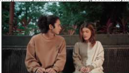
Gambar 9. Scene 15 Film “Dalam Bayang”

Pada Scene 15, sutradara mengarahkan kedua aktor untuk menampilkan hubungan emosional yang intens tanpa perlu dialog berlebihan. Aktor pria diarahkan untuk menatap langsung ke arah lawan mainnya sebagai bentuk perhatian, sementara aktor perempuan menundukkan pandangan dan memegang tangannya sendiri untuk memperlihatkan keraguan dan tekanan batin. Jarak fisik yang masih terjaga di antara keduanya menegaskan jarak emosional yang belum terjembatani.