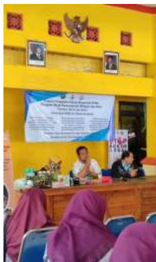
Gambar 3. Sambutan Kepala Desa

Dokumentasi kegiatan pengabdian tersaji dalam Gambar 3 – 7