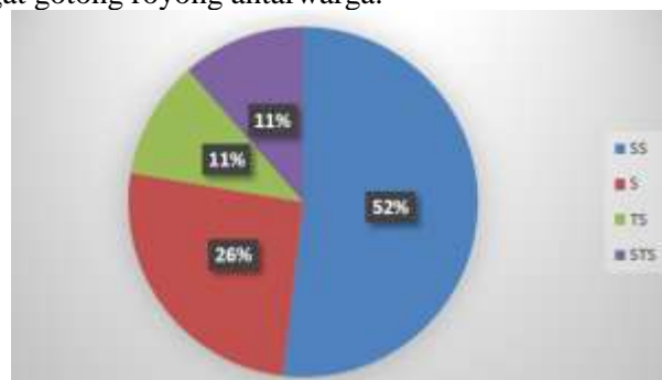
Gambar 2. Pemahaman Pengelolaan Sampah Sebelum Setelah Kegiatan PkM

Pelaksanaan kegiatan PkM menunjukkan peningkatan signifikan pada tingkat pemahaman masyarakat tentang pengelolaan sampah dan bank sampah. Pada awal kegiatan, hanya sekitar 16% warga yang sangat setuju terhadap pemilahan sampah dan bank sampah, namun setelah pelatihan dan sosialisasi, masyarakat yang sangat setuju meningkat hingga 52% (Gambar 2). Dari kegiatan ini PkM ini menunjukkan peningkatan pemahaman kesadaran masyarakat terhadap pentingnya pengelolaan sampah. Masyarakat mulai memahami bahwa sampah memiliki nilai ekonomi dan dapat menjadi sumber penghasilan tambahan. Selain itu, adanya kegiatan rutin penimbangan sampah menciptakan interaksi sosial positif dan semangat gotong royong antarwarga.