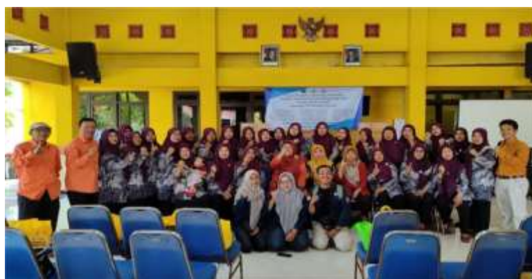
Gambar 7. Warga Masyarakat dan TIM PkM