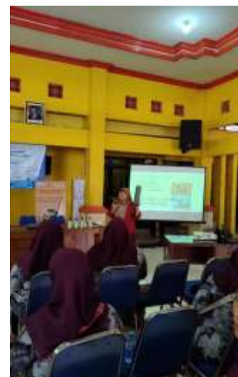
Gambar 4. Sosialisasi Pemilahan Sampah