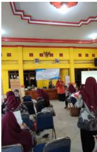
Gambar 5. Sosialisasi Bank Sampah