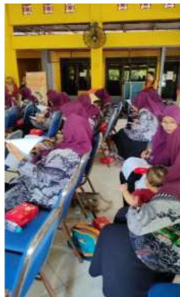
Gambar 6. Peserta Kegiatan Pengabdian