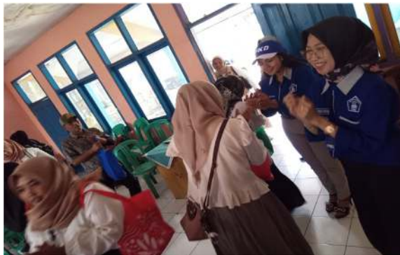
Gambar 3. Peserta dan narasumber beramah tamah setelah kegiatan

Sesi diskusi dan tanya jawab memberikan wawasan tambahan terkait tantangan yang dihadapi dalam menjaga kebersihan desa. Beberapa pemimpin desa menyampaikan kendala utama yang mereka hadapi, seperti minimnya fasilitas pengelolaan sampah, rendahnya kesadaran masyarakat, serta kurangnya dukungan kebijakan yang mendorong budaya hidup bersih. Sebagai solusi, peserta seminar menyepakati perlunya sosialisasi lebih lanjut kepada warga dan inisiatif lokal yang dapat diterapkan, seperti penyediaan tempat sampah terpilah dan program kerja bakti rutin. Hasil evaluasi dari umpan balik peserta menunjukkan bahwa setelah seminar, terdapat peningkatan pemahaman tentang peran pemimpin desa dalam mengedukasi masyarakat mengenai kesehatan lingkungan. Sebagian besar peserta menyatakan kesiapan mereka untuk menerapkan strategi yang telah dibahas dalam kehidupan sehari-hari serta dalam pengambilan kebijakan tingkat desa.