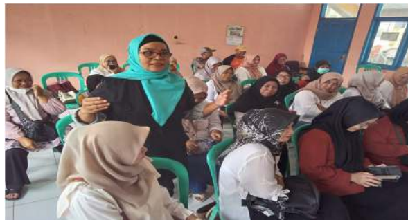
Gambar 2. Salah satu peserta memberikan tanggapan mengenai tantangan dalam mengedukasi warga tentang kebersihan lingkungan

Setelah penyampaian materi, sesi diskusi dan tanya jawab memberikan kesempatan bagi peserta untuk berbagi pengalaman, tantangan, serta solusi dalam menjaga kebersihan lingkungan di desa masing-masing. Evaluasi kegiatan dilakukan melalui umpan balik dari peserta terkait pemahaman mereka terhadap materi yang disampaikan. Tanya jawab singkat dan refleksi di akhir sesi seminar digunakan untuk mengetahui sejauh mana pemimpin desa dapat mengimplementasikan edukasi yang diberikan.