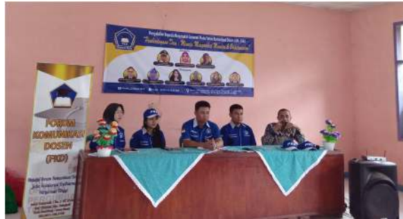
Gambar 1. Narasumber menyampaikan materi tentang edukasi dalam menjaga kesehatan dan kebersihan lingkungan

Seminar disampaikan dalam bentuk ceramah interaktif, dengan fokus pada peran pemimpin desa dalam menjaga kebersihan dan kesehatan lingkungan. Beberapa topik utama yang dibahas meliputi prinsip dasar kesehatan lingkungan, strategi pengelolaan sampah dan sanitasi, serta upaya pemimpin desa dalam mengedukasi masyarakat agar lebih peduli terhadap kebersihan.