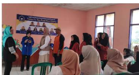
Gambar 2. Sesi ice breaking berlangsung dengan peserta yang bersemangat

Dalam upaya membentuk kebiasaan finansial yang lebih sehat peserta diberikan pelatihan tentang pola konsumsi yang lebih bijak dan efisien. Materi yang disampaikan meliputi pentingnya memasak sendiri di rumah daripada sering membeli makanan di luar, cara mengatur belanja bulanan agar lebih hemat, serta strategi menyusun daftar belanja prioritas untuk menghindari pemborosan.