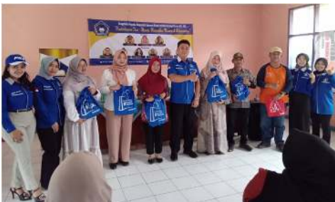
Gambar 3. Forum Komunikasi Dosen mendukung kegiatan dengan pemberian sembako untuk membantu masyarakat

Secara keseluruhan kegiatan PKM ini berhasil meningkatkan pemahaman masyarakat tentang pentingnya kesadaran finansial, serta memberikan solusi praktis dalam menghadapi tantangan ekonomi akibat inflasi. Dengan adanya edukasi ini, diharapkan masyarakat dapat menerapkan strategi keuangan yang lebih baik, menghindari utang konsumtif, serta meningkatkan kebiasaan menabung demi kestabilan ekonomi keluarga mereka. Dukungan dari berbagai pihak dalam bentuk edukasi dan bantuan sosial menunjukkan bahwa sinergi antara akademisi, generasi muda, dan masyarakat dapat memberikan dampak positif dalam meningkatkan kesejahteraan ekonomi masyarakat desa.