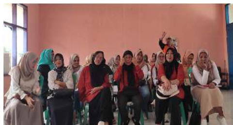
Gambar 1. Peserta bertanya tentang tantangan mengelola keuangan di tengah kenaikan harga

Dalam upaya membentuk kebiasaan finansial yang lebih sehat peserta diberikan pelatihan tentang pola konsumsi yang lebih bijak dan efisien. Materi yang disampaikan meliputi pentingnya memasak sendiri di rumah daripada sering membeli makanan di luar, cara mengatur belanja bulanan agar lebih hemat, serta strategi menyusun daftar belanja prioritas untuk menghindari pemborosan.