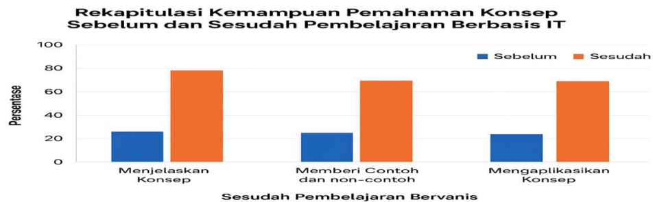
Gambar 1. Rekapitulasi Kemampuan Pemahaman Konsep

Berdasarkan observasi, wawancara, dan analisis dokumen yang dilakukan, penerapan media pembelajaran berbasis IT berupa video dan animasi pada materi bangun datar menunjukkan adanya perkembangan yang jelas pada kemampuan pemahaman konsep siswa kelas IV SD Negeri Gunungkembang sebagaimana ditunjukkan pada diagram berikut: