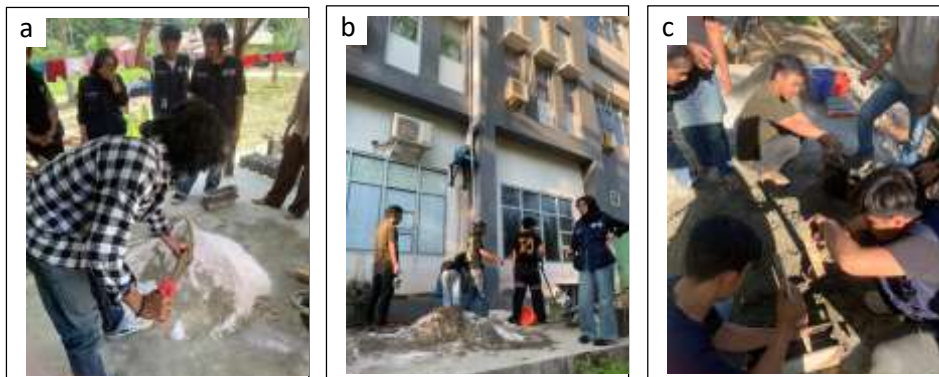
Gambar 5. Proses pembuatan batako: (a) pencampuran material; (b) penambahan air; (c) pencetakan batako interlock

Proses pencampuran material dilakukan dengan mencampur semen, pasir, dan abu sekam padi secara merata sebelum ditambahkan air. Mahasiswa KKN Tematik secara langsung mempraktikkan perbandingan campuran yang sudah dihitung, termasuk teknik pencampuran hingga homogen. Proses pencetakan dilakukan dengan menggunakan alat cetak batako interlock dimana material campuran dipadatkan secara manual.