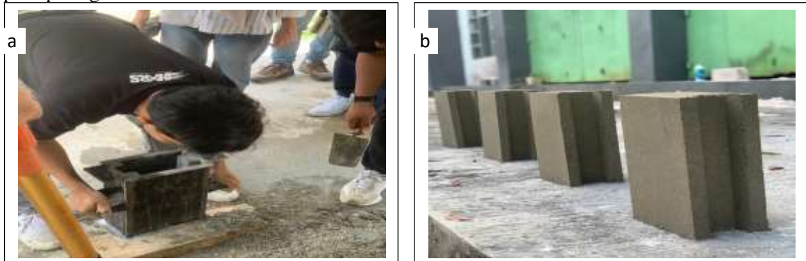
Gambar 5. Proses pembuatan batako abu sekam padi interlock (BATASIK))

(BSN, 1989). Dalam kegiatan uji coba ini, tim KKN Tematik dibimbing oleh dosen pendamping lapangan (DPL) telah mengetahui mekanisme pembuatan batako abu sekam padi interlock, dengan hasil seperti pada gambar berikut: