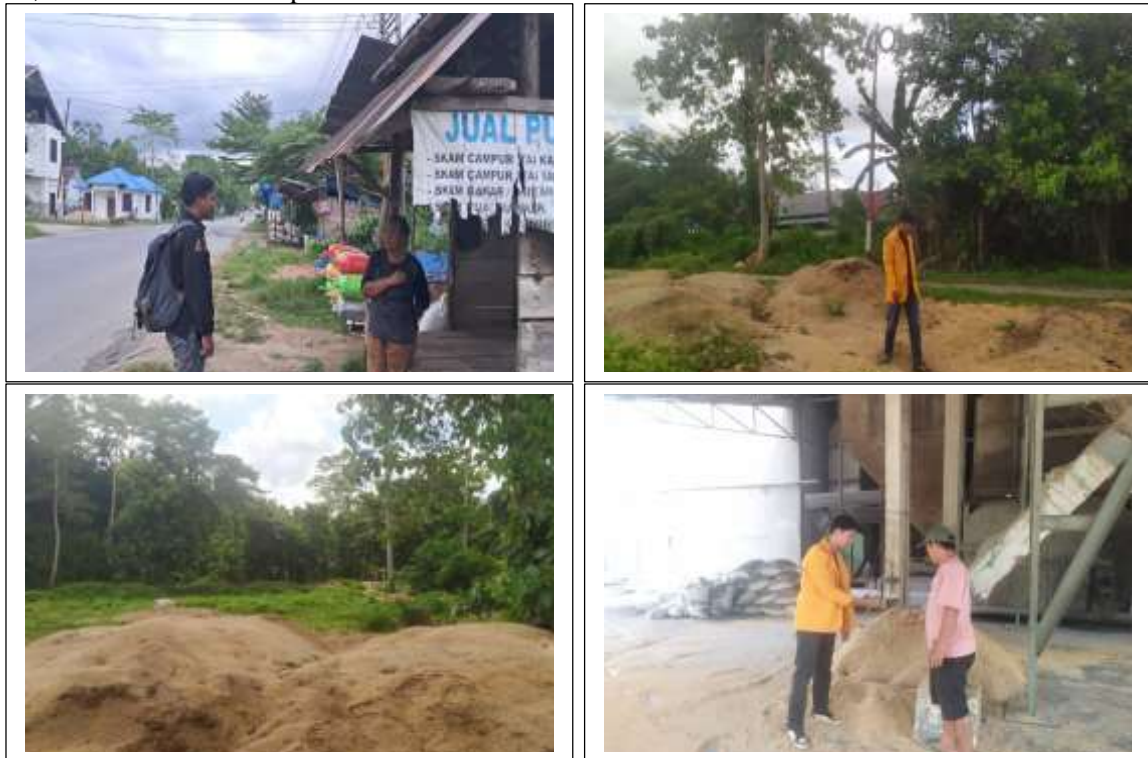
Gambar 1. Lokasi pengambilan abu sekam padi di Desa Amoito, Kabupaten Konawe Selatan

yang diperoleh dari lokasi penjualan abu sekam padi di Desa Amoito, Kabupaten Konawe Selatan. Berdasarkan penelitian Ngii et al. (2023), komposisi optimal yang digunakan adalah 30% semen, 35% pasir, dan 35% abu sekam padi.