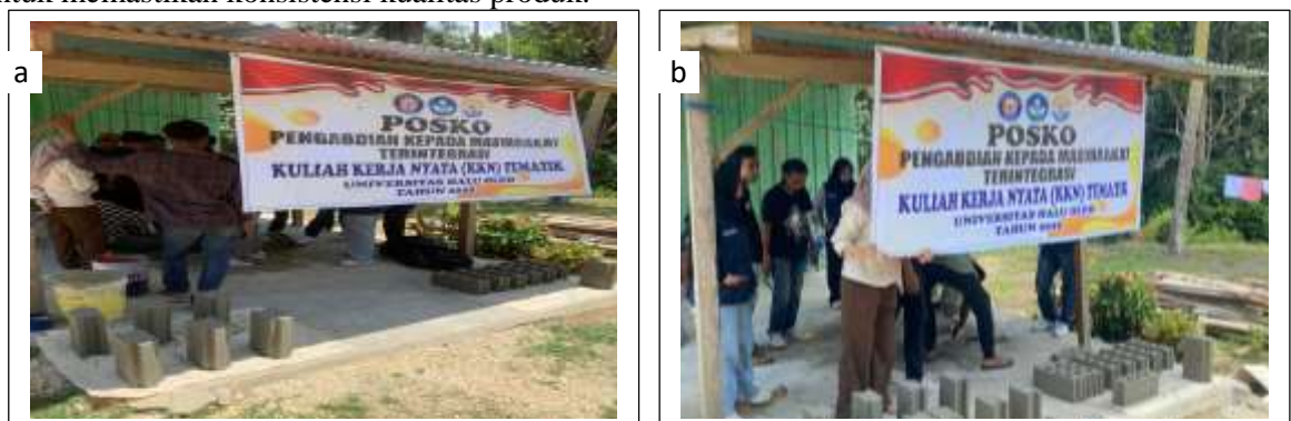
Gambar 6. Hasil bimbingan teknis pembuatan batako interlock oleh mahasiswa KKN Tematik di Desa Sandey Kab. Konawe Selatan

Pelatihan dilaksanakan dalam dua tahap: pelatihan teori selama 2 hari yang mencakup pemahaman tentang karakteristik abu sekam padi sebagai bahan pozzolan, prinsip sistem interlock, dan standar kualitas SNI; serta pelatihan praktik selama 5 hari yang meliputi persiapan bahan, teknik pencampuran, pencetakan, proses pengerasan, dan kontrol kualitas. Selama periode pendampingan 4 minggu, tim melakukan monitoring intensif terhadap proses produksi dan memberikan bimbingan teknis untuk memastikan konsistensi kualitas produk.