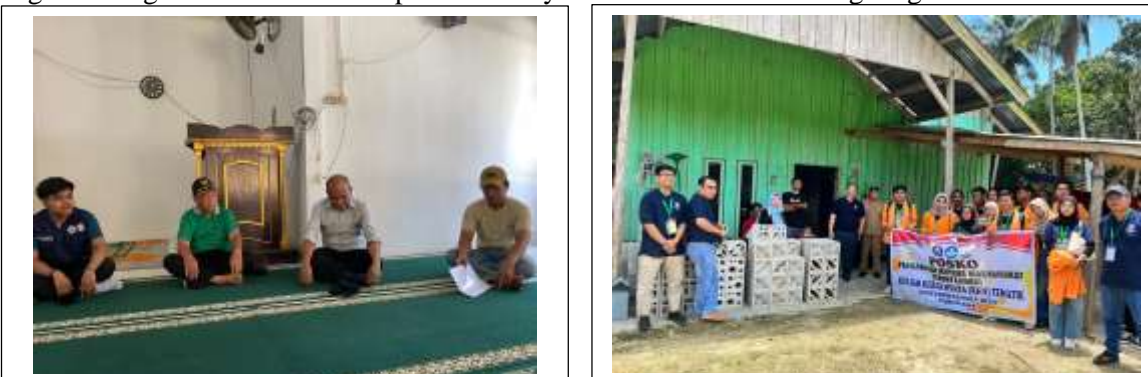
Gambar 2. Kegiatan Kordinasi Pemerintah Desa dan Mitra UMKM Zidan Roster pada Program KKN Tematik mahasiswa FT UHO di Desa Sandey, Kab. Konawe Selatan

Meliputi koordinasi dengan Pemerintah Desa Sandey, survei kondisi eksisting produksi batako, analisis potensi bahan baku abu sekam padi, dan pembekalan mahasiswa KKN Tematik sebanyak 15 orang dari Program Studi Teknik Sipil dan Rekayasa Infrastruktur dan Lingkungan.