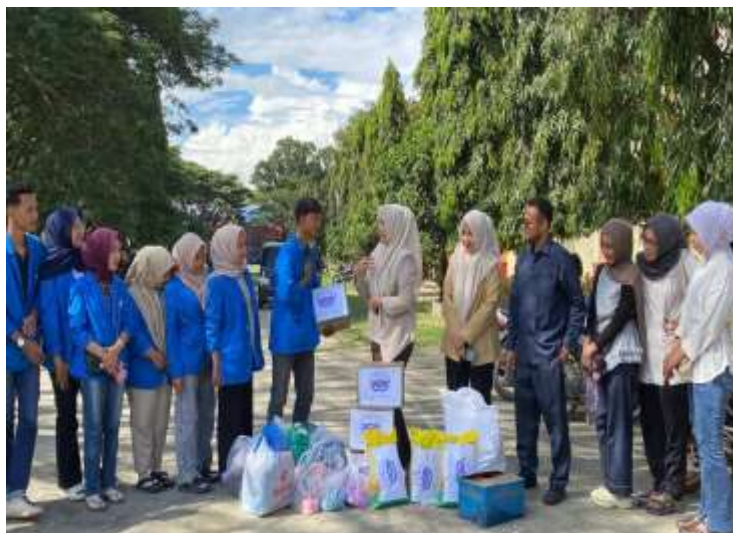
Gambar 1. Sosialisasi Dosen dan Mahasiswa dalam Kunjungan Aksi peduli kemanusiaan dalam penanggulangan dampak banjir bandang di Kabupaten Aceh Tenggara