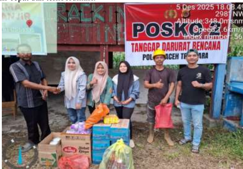
Gambar 3. Proses Distribusi Bantuan kemanusiaan yang dilakukan Dosen bersama Perangkat Desa dan relawan lokal

kepercayaan masyarakat dan efektivitas penyaluran, terutama dalam situasi bencana hidrometeorologi yang menuntut respons cepat dan terkoordinasi.