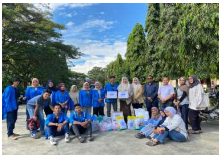
Gambar 2. Persiapan Dosen Dan Mahasiswa Universitas Gunung Leuser Menuju Korban Banjir Bandang Di Kabupaten Aceh Tenggara

Pelaksanaan aksi peduli kemanusiaan dalam penanggulangan dampak banjir bandang di Kabupaten Aceh Tenggara dilakukan sebagai bentuk kepedulian terhadap warga terdampak serta upaya pemulihan awal pascabencana. Kegiatan ini dilaksanakan melalui beberapa tahapan: asesmen kebutuhan, distribusi bantuan darurat, pendampingan psikososial, edukasi kebencanaan, serta koordinasi dengan pemerintah daerah dan relawan lokal. Bagian ini menjelaskan hasil pelaksanaan kegiatan secara kuantitatif dan kualitatif, perubahan nyata yang dialami masyarakat, serta analisis terhadap efektivitas aksi kemanusiaan tersebut berdasarkan literatur terdahulu.