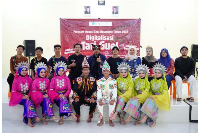
Penari Sanggar Genali