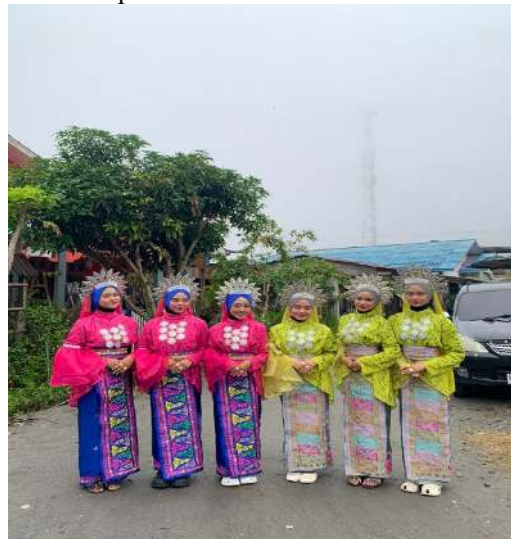
Penari Sanggar Genali