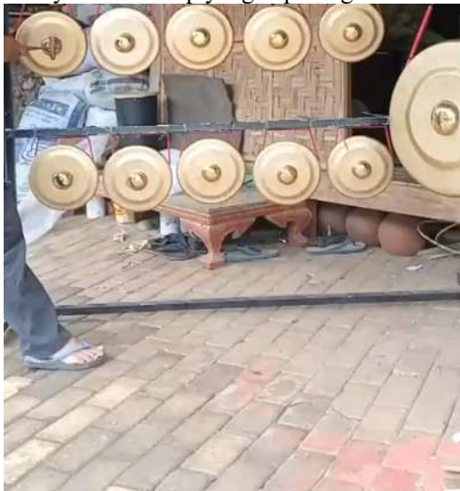
Alat musik yang di serahkan untuk Mitra