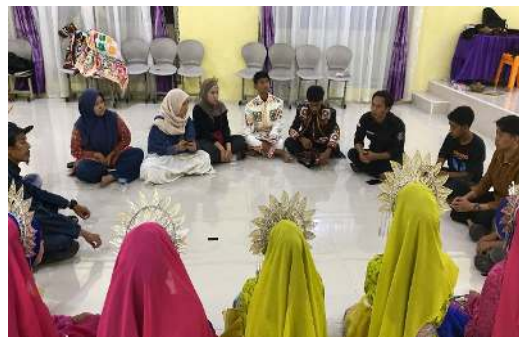
Pengayaan Tim Pengabdian dan Sanggar Genali