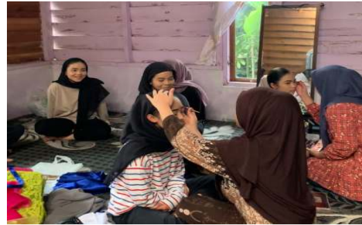
Gambar 4. Pendampingan make up dari tim pengabdian ke Anggota Sanggar