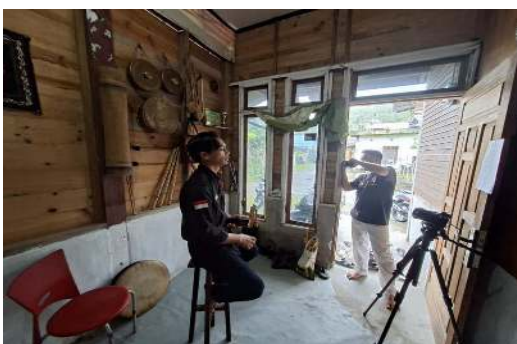
Gambar 1. Tahap Pendokumentasian Karya