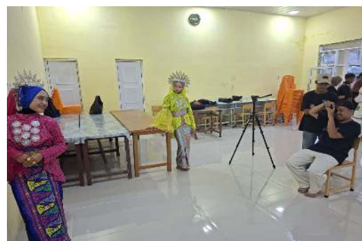
Gambar 2. Tahap digitalisasi karya