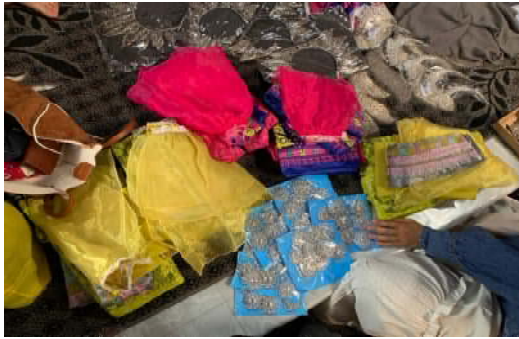
Gambar 3. Pengadaan Kostum untuk Mitra