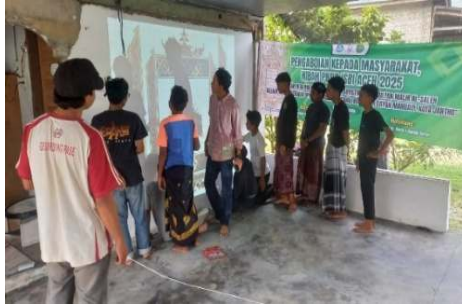
Gambar 7. Proses Implementasi Sketsa Pada Media Mural (Dokumentasi Salman. 2025)