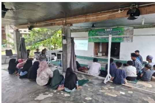
Gambar 1. Deseminasi ,Yang Membahas Tentang Seni Rupa Sebagai Strategi Penguatan Pendidikan Di Dayah (Dokumentasi salman. 2025)

Dalam pemaparan materoi pertama ini disampaikan tim PKM menyampaikan beberapa poin penting kepada para guru dan santri didayah ini. Oin itu membahas tentang Seni rupa Islam memiliki peran signifikan dalam memperkuat proses pendidikan di dayah karena menjadi sarana untuk menanamkan nilai adab, estetika, serta spiritualitas secara holistik. Melalui pembelajaran kaligrafi, motif arabes, dan pola-pola geometris, para santri tidak hanya mempelajari teknik berkesenian, tetapi juga mendalami makna tauhid yang tercermin dalam prinsip keteraturan, harmoni, dan keserasian.