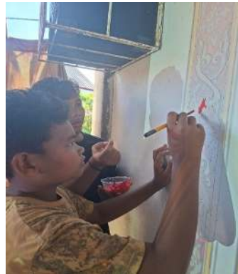
Gambar 8. Proses Pewarnaan Mural

Tahap pewarnaan dan finishing mural merupakan langkah krusial untuk menghasilkan karya yang menarik dan tahan lama. Pada proses pewarnaan, menerapkan warna dasar dan lapisan-lapisan cat sesuai rancangan, menggunakan kuas, rol, dengan memperhatikan pencampuran warna, dan detail motif. Setelah cat kering, tahap finishing dilakukan dengan menambahkan pelindung untuk menjaga warna agar tidak pudar akibat sinar matahari, hujan, atau debu, sekaligus menciptakan efek kilap atau matte sesuai kebutuhan. Penerapan pewarnaan yang teliti dan finishing yang tepat tidak hanya meningkatkan keindahan mural, tetapi juga memperpanjang umur dan ketahanan karya seni dinding tersebut.