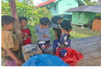
Gambar 5. Proses Pengenalan Bahan Mural

Pengenalan bahan dalam pembuatan mural merupakan langkah krusial karena pemilihan material yang tepat akan menentukan kualitas, ketahanan, dan penampilan karya seni dinding tersebut. Bahan-bahan utama yang biasa digunakan meliputi cat akrilik, dengan pertimbangan keefektifan dan daya tahan terhadap cuaca, kecerahan warna, serta teknik aplikasinya. Selain itu, permukaan media mural seperti dinding beton, perlu dipersiapkan dengan lapisan primer agar cat melekat dengan baik dan awet. Memahami sifat bahan, warna, dan cara pengaplikasiannya memungkinkan santri di dayah dapat menyalurkan ide kreatif secara maksimal sekaligus memastikan mural tetap indah dan tahan lama.