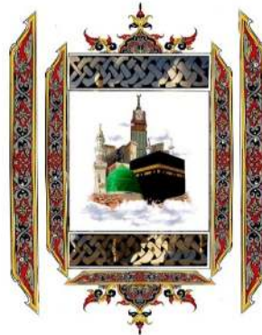
Gambar 6. Desain Mural (Dokumentasi Salman. 2025 )

Penerapan desain mural pada dinding meunasah dayah diawali dengan mentransfer desain ke permukaan dinding menggunakan infokus dan kemudian jelaskan visualnya menggunakan pensil dan kapur sebagai panduan. Setelah garis besar terlihat, tim PKM mengajarkan para santri dayah untuk melanjutkan dengan mengaplikasikan warna secara bertahap, sambil memperhatikan proporsi, gradasi, dan detail motif khas Aceh. Setelah pewarnaan selesai, tahap finishing dilakukan dengan melapisi mural menggunakan pelapisan bahan untuk melindungi warna dari cuaca dan meningkatkan ketahanan.