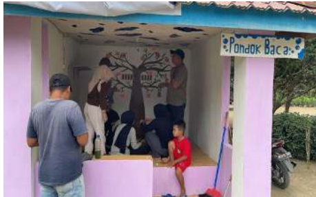
Gambar 1. Dokumentasi Renovasi Pondok Baca

Renovasi dilakukan dengan menata ulang interior ruangan, memperbaiki pencahayaan, mengecat ulang dinding agar lebih cerah, serta memperbaiki tata letak rak buku sehingga ruangan tampak lebih rapi dan nyaman. Selain itu, dilakukan penambahan fasilitas berupa meja, dan koleksi buku baru.