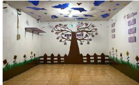
Gambar 2. Dokumentasi Hasil Renovasi Pondok Baca