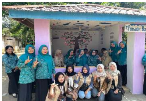
Gambar 3. Dokumentasi Peresmian Pondok Baca