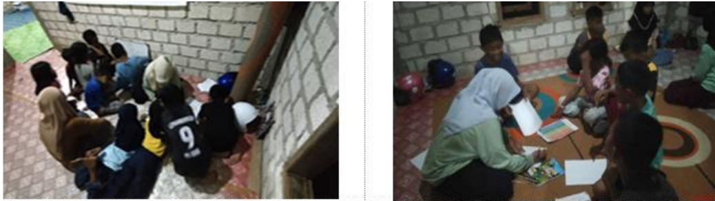
Gambar 1 Membuat catatan dan resume

Selanjutnya pembelajaran dilanjutkan dengan membentuk Kelompok dengan Mendorong anak-anak untuk belajar dalam kelompok kecil, sehingga mereka dapat saling berinteraksi dan bekerja sama dalam menyelesaikan permasalahan pada pembelajaran, yang pada gilirannya dapat meningkatkan rasa percaya diri dalam mengemukakan pendapat serta menumbuhkan keterampilan sosial mereka dalam berkelompok sehingga saling menerima pendapat masing-masing. Pada pembelajaran berkelompok anak-anak saling melengkapi dan bekerjasama sehingga menyelesaikan permasalahan dengan tepat waktu.