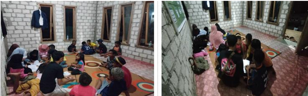
Gambar 2 Pembelajaran berbasis kelompok

Selanjutnya pembelajaran dilanjutkan dengan membentuk Kelompok dengan Mendorong anak-anak untuk belajar dalam kelompok kecil, sehingga mereka dapat saling berinteraksi dan bekerja sama dalam menyelesaikan permasalahan pada pembelajaran, yang pada gilirannya dapat meningkatkan rasa percaya diri dalam mengemukakan pendapat serta menumbuhkan keterampilan sosial mereka dalam berkelompok sehingga saling menerima pendapat masing-masing. Pada pembelajaran berkelompok anak-anak saling melengkapi dan bekerjasama sehingga menyelesaikan permasalahan dengan tepat waktu.