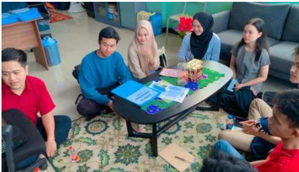
Gambar 2. Pemaparan Materi Kebijakan Ekonomi oleh Nara Sumber

Berdasarkan pemaparan materi tentang masalah perekonomian, para peserta kegiatan penguatan tampak antusias menyimak materi tentang masalah perekonomian pada dasar ilmu ekonomi ini.