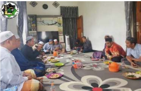
Gambar 2. Promosi di Ampah Kabupaten Barito Timur

Adapun promosi offline di Kalimantan Tengah dilaksanakan di pasar Ampah Kabupaten Barito Timur dapat dilihat pada gambar 2 berikut ini: