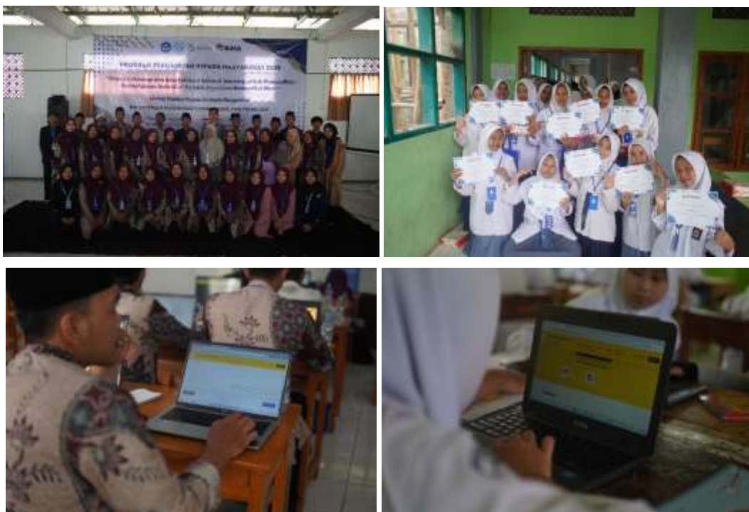
Gambar 3. Pelaksanaan Pelatihan e-learning untuk Guru dan Siswa