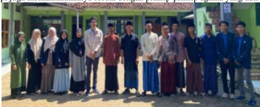
Gambar 2. Observasi dan Sosialisasi Kegiatan

Relevansi penerapan teknologi di Pondok Pesantren ini sangat tinggi. Sebagian besar santri berasal dari keluarga kurang mampu, yang membuat mereka kesulitan mengakses pendidikan berbasis teknologi. Dengan pengembangan platform e-learning berbasis Moodle dan pemberian perangkat keras, santri dapat mengakses materi pembelajaran dengan lebih mudah. Selain itu, pelatihan literasi digital berbasis nilai spiritual memastikan bahwa santri dan pengajar tidak hanya menguasai penggunaan teknologi, tetapi juga memanfaatkannya sesuai dengan prinsip-prinsip agama yang ada.