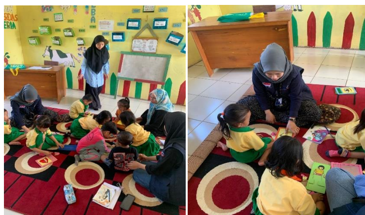
Gambar 1. Membantu tenaga pendidik TK/Paud