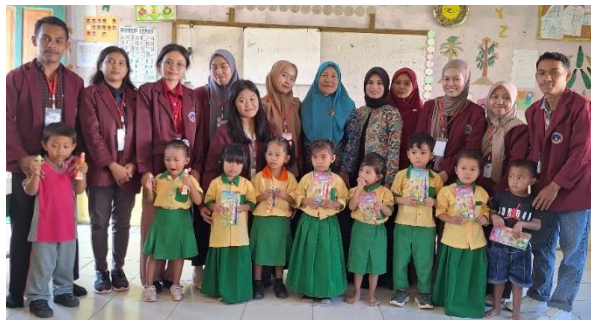
Gambar 3. Penerapan PHBS