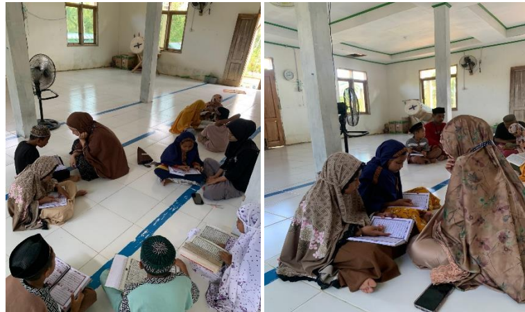
Gambar 2. Kegiatan Mengajar TPQ