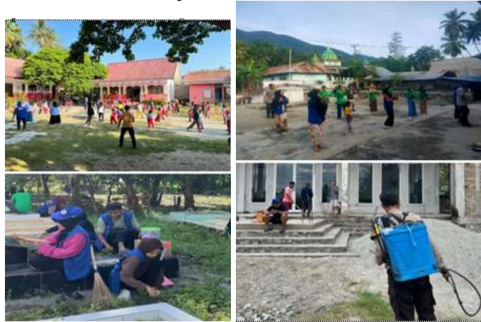
Gambar 3. Kegiatan Senam Pagi & Kerja Bakti

Kegiatan kerja bakti merupakan bentuk lain dari program sosial yang bertujuan memupuk solidaritas antarwarga melalui gotong royong. Hasil pengamatan menunjukkan bahwa partisipasi kerja bakti cukup rendah dibandingkan ekspektasi awal. Warga yang hadir didominasi oleh kalangan lanjut usia dan aparat desa, sementara kelompok usia muda lebih sedikit terlibat. Hasil wawancara mengindikasikan bahwa kurangnya koordinasi dan sosialisasi menjadi penyebab utama rendahnya kehadiran warga. Sebagian masyarakat mengaku tidak mendapatkan informasi yang jelas mengenai jadwal dan tujuan kegiatan. Meskipun demikian, kegiatan tetap terlaksana dan berhasil membersihkan sebagian area publik di sekitar jalan utama desa. Faktor komunikasi internal antara pelaksana dan masyarakat perlu diperbaiki agar kegiatan semacam ini dapat berjalan lebih efektif pada masa mendatang. Kesadaran untuk menjaga kebersihan lingkungan memerlukan pembiasaan yang melibatkan seluruh elemen masyarakat secara berkelanjutan.