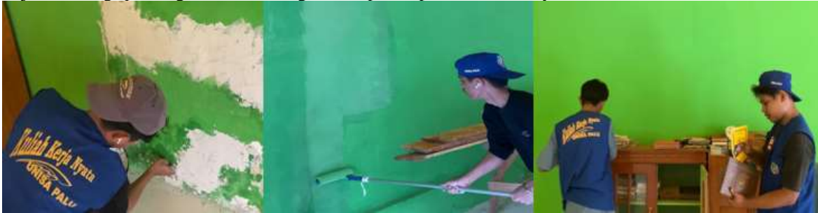
Gambar 1. Renovasi TPA Al-Huda Desa Sibonu Kecamatan Dolo Barat

Pelaksanaan kegiatan pengecatan taman pengajian anak menjadi salah satu kegiatan yang paling diminati oleh warga. Hasil pengamatan menunjukkan antusiasme yang cukup tinggi dari para ibu rumah tangga dan pengurus pengajian setempat. Kegiatan ini dianggap relevan karena berkaitan dengan fasilitas keagamaan dan pendidikan anak yang menjadi bagian dari kehidupan sosial masyarakat Desa Sibonu. Warga berpartisipasi tidak hanya dalam bentuk tenaga tetapi juga dengan menyediakan alat bantu sederhana seperti kuas dan cat tambahan. Proses pelaksanaan kegiatan ini berlangsung selama dua hari dan mendapat dukungan dari tokoh agama setempat. Kehadiran tokoh agama terbukti meningkatkan semangat masyarakat untuk ikut serta, menunjukkan bahwa keberadaan pemimpin lokal memiliki pengaruh signifikan terhadap partisipasi warga. Faktor kedekatan nilai religius menjadi pendorong utama keberhasilan kegiatan ini. Hal ini memperlihatkan bahwa pendekatan nilai keagamaan dapat menjadi strategi penting dalam meningkatkan partisipasi sosial masyarakat desa.