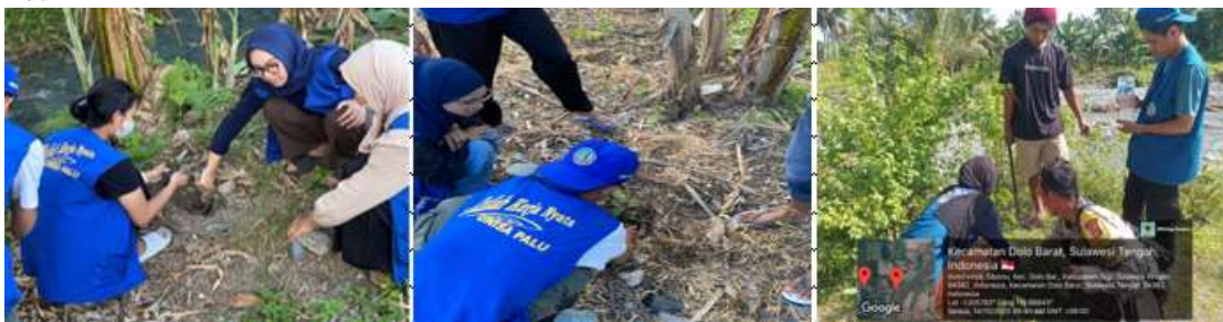
Gambar 2. Kegiatan Penghijauan Desa (Penanaman Pohon)

Kegiatan penanaman pohon menghadapi kendala cukup besar dari segi keikutsertaan masyarakat. Sebagian besar warga kurang terlibat secara langsung dalam pelaksanaan kegiatan ini. Observasi lapangan menunjukkan bahwa hanya sebagian kecil warga, terutama aparat desa dan pemuda karang taruna, yang turut membantu mahasiswa dalam penanaman. Kurangnya partisipasi ini disebabkan oleh waktu pelaksanaan yang bertepatan dengan musim tanam, sehingga mayoritas warga lebih banyak bekerja di lahan pertanian mereka. Hasil wawancara menunjukkan bahwa sebagian warga memandang program penanaman pohon sebagai kegiatan yang manfaatnya belum dirasakan secara langsung. Faktor jarak dan beban kerja harian menjadi alasan utama rendahnya keterlibatan masyarakat. Meski demikian, kegiatan ini tetap terlaksana dan menghasilkan taman kecil yang kini menjadi area hijau sekitar balai desa. Adanya hasil fisik dari kegiatan ini diharapkan dapat menumbuhkan kesadaran baru tentang pentingnya menjaga lingkungan di bantaran sungai desa Sibonu bagi generasi muda desa Sibonu.