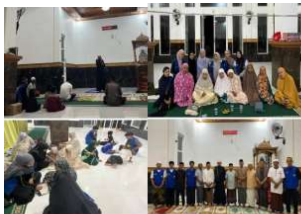
Gambar 4. Kegiatan Majelis Ta'lim

Majelis taklim menjadi kegiatan dengan tingkat partisipasi tertinggi di antara seluruh program yang dilaksanakan. Keikutsertaan warga, terutama perempuan dan kelompok usia lanjut, terbilang sangat tinggi. Faktor keagamaan dan kultural berperan besar dalam mendorong keterlibatan masyarakat pada kegiatan ini. Majelis taklim dianggap sebagai forum penting bagi warga untuk memperoleh ilmu agama sekaligus mempererat hubungan sosial. Tokoh agama dan aparat desa berperan penting sebagai penggerak utama kegiatan ini, sehingga penyelenggaraannya berjalan lancar dan mendapat dukungan moral yang kuat. Hasil kegiatan menunjukkan bahwa masyarakat lebih responsif terhadap program yang relevan dengan nilai-nilai spiritual dan budaya lokal. Temuan ini menegaskan pentingnya kontekstualisasi program sosial dengan karakteristik sosial masyarakat setempat. Kegiatan keagamaan terbukti menjadi sarana paling efektif dalam menumbuhkan semangat kebersamaan dan partisipatif di lingkungan Desa Sibonu.