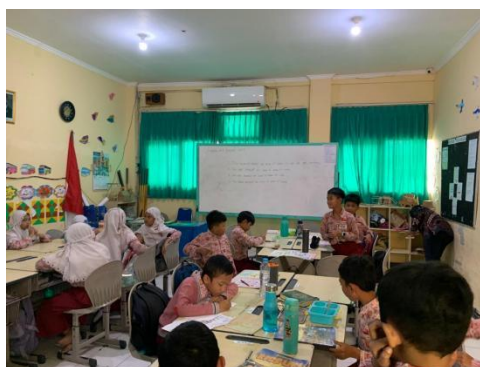
Gambar 3. Kelas 3B

Saat melakukan pengalihan perhatian, wali kelas melakukannya di bagian ujung kelas untuk menghindarkan anak inklusi dari keramaian, sehingga mereka dapat lebih fokus. Dengan cara ini, siswa inklusi secara perlahan akan merasa lebih tenang dibandingkan sebelumnya. Selain itu, pihak sekolah juga menyediakan fasilitas yang disesuaikan dengan kebutuhan siswa untuk meminimalkan kejadian yang tidak diinginkan.