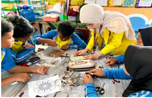
Gambar 1. Proses pembuatan Alat Batik Cap