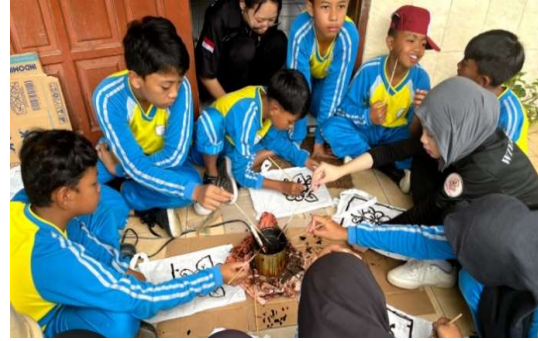
Gambar 2. Proses Pembuatan Batik Tulis Sederhana

Dalam kegiatan pembuatan alat batik cap dan batik tulis ini diikuti dengan baik oleh para siswa/i kelas 4,5,6 SDN Penanggungan. Para siswa mengakui bahwa proses pembuatan batik, salah satunya adalah batik tulis termasuk ke dalam pembuatan batik yang memerlukan waktu yang lama untuk menghasilkan produk yang istimewa.