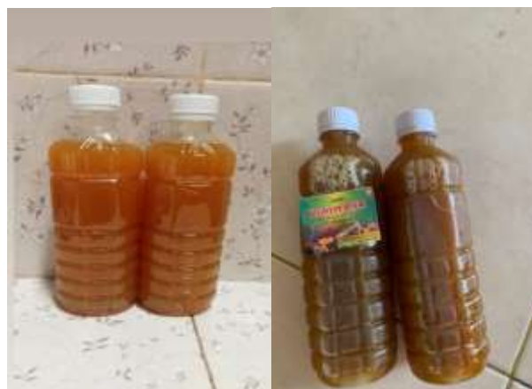
Gambar 4. Pertemuan terakhir dengan nasabah (before dan after)

Pada tahap terakhir, fasilitator melakukan evaluasi hasil pendampingan untuk melihat sejauh mana perkembangan usaha nasabah setelah mengikuti seluruh rangkaian kegiatan. Evaluasi ini dilengkapi dengan survei kepuasan nasabah, yang digunakan untuk menilai pengalaman nasabah selama proses pendampingan bersama fasilitator. Selain itu, fasilitator juga menyusun before-after atau perbandingan kondisi sebelum dan sesudah pendampingan melalui aplikasi “KitaBestee” sebagai dokumentasi perubahan dan peningkatan yang terjadi. Setelah seluruh proses selesai, fasilitator menutup kegiatan dengan berpamitan kepada nasabah secara baik untuk menjaga hubungan yang harmonis dan profesional.