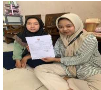
Gambar 3. Pertemuan ketiga dengan nasabah (praktik bersama nasabah)

Tahap ketiga membutuhkan waktu yang cukup lama pada tahap ini berfokus pada praktik langsung yang dilakukan bersama nasabah sebagai bagian dari rangkaian pendampingan seperti pembuatan desain logo, desain benner dan juga pembuatan Nomer Induk Berusaha (NIB), tergantung dari kebutuhan nasabah.