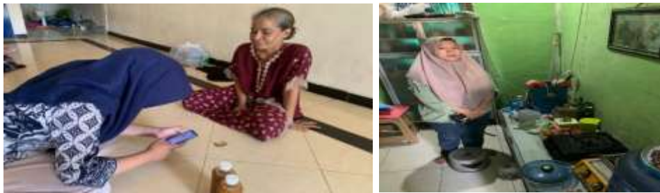
Gambar 1. Pertemuan pertama dengan nasabah (Assesmen usaha)

Awal pendampingan berfokus pada asesmen usaha, yaitu perkenalan kepada nasabah proses wawancara langsung kepada nasabah untuk menggali kondisi usaha secara mendalam. Pada tahap ini, fasilitator mengidentifikasi kebutuhan, peluang, serta potensi setiap pelaku usaha dengan menggunakan pendekatan SWOT (Strengths, Weaknesses, Opportunities, Threats). Nasabah diberikan sejumlah pertanyaan terstruktur, seperti jumlah pendapatan per hari, jumlah produk yang terjual dalam satu hari, serta berbagai kendala yang dihadapi selama menjalankan usaha. Seluruh pertanyaan tersebut telah disiapkan dan disajikan secara sistematis melalui aplikasi “KitaBestee”, sehingga proses asesmen menjadi lebih terarah, efisien, dan mudah dicatat.