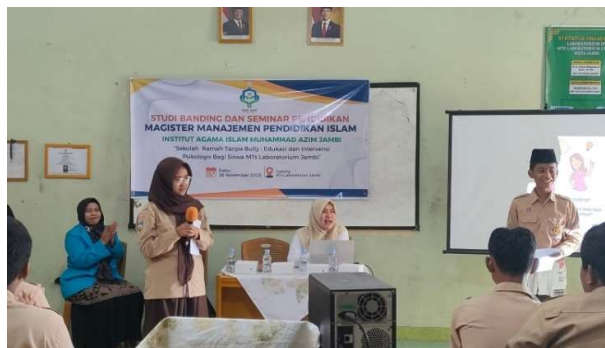
Gambar 4. Siswa Menceritakan Pengalaman Pribadi Tentang Perundungan

Ini sesuai dengan prinsip “komunikasi terbuka”, bahwa pencegahan bullying harus dimulai dari keberanian melapor dan lingkungan yang mendukung siswa untuk berbicara. Pemateri memberikan penguatan psikologis, menekankan pentingnya saling menghormati serta meminta siswa untuk tidak ragu mencari bantuan saat mengalami masalah emosional, sebagaimana berbagai isu kesehatan mental siswa (misalnya kecemasan, kesepian, insecure, dan stres akademik).