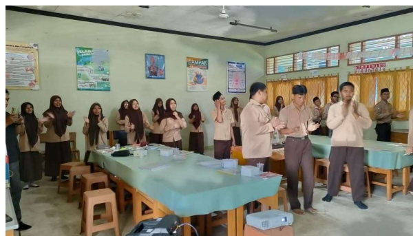
Gambar 3. Siswa Memperagakan Bullying

Selama sesi role play atau unjuk kerja, siswa mampu menampilkan simulasi situasi bullying dengan baik. Mereka bergantian menjadi pelaku, korban, dan saksi, lalu mendiskusikan cara merespons yang tepat.