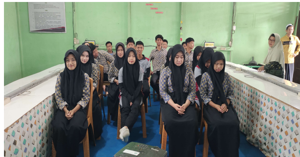
Gambar 1. Siswa/Peserta Pendampingan

Pada tahap analisis kebutuhan, siswa menunjukkan keterbukaan dan antusiasme dalam mengemukakan potensi serta hambatan yang mereka alami selama ini. Data awal menunjukkan bahwa 72% siswa tertarik pada usaha kuliner kecil, tetapi kesulitan dalam menentukan bahan baku halal dan pengemasan yang sesuai standar. Selain itu, pemahaman siswa mengenai konsep edupreneurship masih terbatas pada jual beli sederhana tanpa integrasi nilai pendidikan, kreativitas, dan kemandirian. Temuan ini sejalan dengan studi Wahyudi (2021) bahwa analisis kebutuhan merupakan fondasi penting dalam merancang program pemberdayaan yang efektif di lingkungan sekolah.