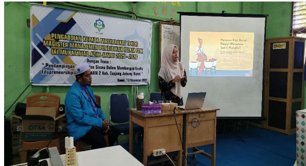
Gambar 3. Pemberian Materi Oleh Narasumber

siswa di MAN 2 berperan sebagai penjual dan pembeli. Melalui aktivitas ini, siswa membuat pasar mini atau bazar kelas yang memberikan pengalaman langsung dalam berwirausaha, mulai dari menawarkan produk hingga bertransaksi secara sederhana. Kegiatan simulatif ini menunjukkan peningkatan signifikan dalam kemampuan siswa berkolaborasi, menganalisis peluang pasar, serta menyusun mini business plan. Pendekatan dialogis yang digunakan selama workshop terbukti mendorong kreativitas siswa sebagaimana direkomendasikan oleh Zimmerman (2018) dalam pendidikan kewirausahaan berbasis sekolah.