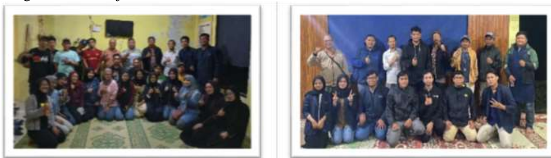
Gambar 1. Sosialisasi dengan Mitra

Tahap awal dilakukan melalui observasi lapangan, wawancara, dan diskusi kelompok terarah (FGD) (Gambar 1) dengan KUBE “Dwi Tunggal” dan Pokdarwis “Sewu Kembang” Dusun Nglurah untuk mengidentifikasi permasalahan, kebutuhan, serta potensi lokal yang dapat dikembangkan dalam kerangka ekonomi hijau.