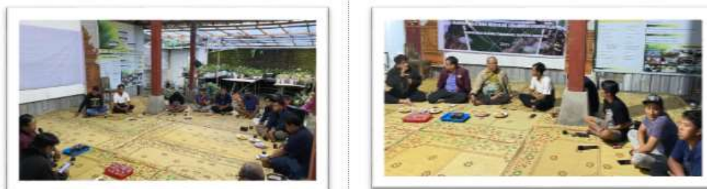
Gambar 3. Pemaparan Strategi Pemasaran dan Evaluasi Ketercapaian

Pada bidang pemasaran (Gambar 3), hasil yang dicapai meliputi tersusunnya strategi pemasaran berbasis nilai kearifan lokal dan ekonomi hijau, terbentuknya identitas merek produk pupuk kompos, serta tersedianya media promosi berupa flyer dan akun media sosial. Pemanfaatan pemasaran digital membuka akses pasar yang lebih luas dan meningkatkan daya saing produk lokal. Penentuan harga produk dilakukan secara rasional dengan mempertimbangkan biaya produksi, nilai lingkungan, dan daya beli konsumen.