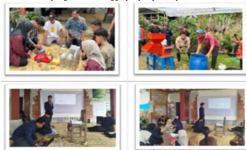
Gambar 2. Workshop Pembuatan Produk dan FGD Penyusunan SOP

Workshop dilanjutkan dengan pelatihan pembuatan pupuk kompos yang memanfaatkan limbah organik rumah tangga dan pertanian di lingkungan Dusun Nglurah. Kegiatan ini mencakup pengenalan jenis bahan baku, teknik pencampuran, proses fermentasi, pengendalian kelembapan, serta indikator kematangan kompos. Pelatihan dilakukan secara praktik langsung untuk memastikan peserta memiliki keterampilan teknis yang dapat diterapkan secara mandiri dalam kegiatan produksi sehari-hari. Sebagai tindak lanjut dari kegiatan workshop, tim pengabdian bersama mitra menyusun Standar Operasional Prosedur (SOP) produksi untuk minuman cascara dan pupuk kompos. Penyusunan SOP dilakukan secara partisipatif dengan mempertimbangkan kondisi lokal, kapasitas sumber daya manusia, serta ketersediaan sarana dan prasarana produksi. SOP yang dihasilkan mencakup tahapan persiapan bahan baku, proses produksi, pengendalian mutu, pengemasan, hingga penyimpanan produk.