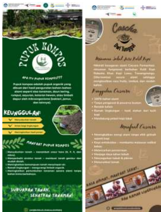
Gambar 4. Aktivitas Kegiatan Pemasaran

Secara keseluruhan, kegiatan pengabdian ini memperkuat posisi Kampung Wisata Sewu Kembang sebagai model pengembangan desa wisata berbasis kearifan lokal dan ekonomi hijau. Sinergi antara aspek produksi ramah lingkungan, manajemen yang tertata, dan pemasaran yang inovatif menjadi faktor kunci dalam mendorong kemandirian ekonomi masyarakat Dusun Nglurah. Tingkat keberdayaan mitra KUBE Dwi Tunggal dan Pokdarwis Sewu Kembang saat ini masih berada pada tahap awal pengembangan. Peningkatan omzet atau revenue generating sebagai indikator kemandirian ekonomi belum dapat tercapai secara optimal. Namun hasil dan keluaran dari kegiatan pengabdian masyarakat yang dilakukan tertuang dalam Tabel 1.