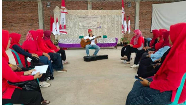
Gambar 4. Pelaksanaan evaluasi kegiatan pengabdian cipta lagu