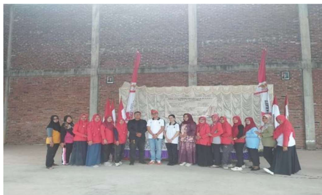
Gambar 3. Pelaksanaan pengabdian cipta lagu

Diskusi hasil kegiatan ini mengindikasikan bahwa pembelajaran musik tidak hanya memerlukan media fisik, tetapi juga kapasitas guru dalam memahami dasar-dasar musik. Pelatihan membaca notasi musik terbukti menjadi solusi efektif untuk mengatasi keterbatasan media pembelajaran musik di PAUD Sambirejo. Guru yang memiliki pengetahuan musikal dapat menciptakan lagu sendiri, mendokumentasikan karya, serta menerapkan variasi metode pembelajaran yang lebih kreatif dan inovatif. Dengan demikian, peningkatan kemampuan musikal guru tidak hanya memberikan manfaat langsung bagi kualitas pembelajaran musik, tetapi juga menjadi investasi jangka panjang bagi perkembangan anak usia dini di Sambirejo. Keberhasilan kegiatan ini mendukung literatur sebelumnya bahwa intervensi pelatihan berbasis seni dapat meningkatkan kompetensi pendidik dan menciptakan pembelajaran yang lebih bermakna (Dewi, 2021; Baret 1973). Program ini juga menjadi bukti bahwa kemitraan antara perguruan tinggi dan masyarakat dapat menghasilkan solusi nyata bagi peningkatan kualitas pendidikan di tingkat lokal.