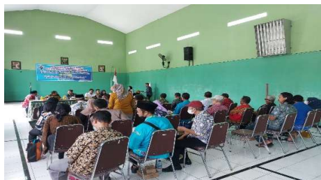
Gambar 1. Sosialisasi Pengurus BUM Desa Suwaluh Mandiri Sejahtetrah dan Masyarakat

Unit usaha ini dikerjakan sepenuhnya oleh masyarakat setempat. Peran BUM Desa adalah menyediakan tempat usaha dan modal. Sistem bagi hasil yang diterapkan usaha ini adalah dengan pembagian 70% dari keuntungan untuk pengrajin dan 30% dari keuntungan untuk BUM Desa. Keuntungan yang dihasilkan oleh unit ini sebesar Rp 800.000,-. Adapun kendala yang dihadapi dari unit usaha ini adalah keterbatasan dalam pemasaran produk batik.