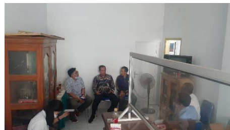
Gambar 2. FDG Bersama Pengurus BUM Desa Suwaluh Mandiri Sejahtetrah