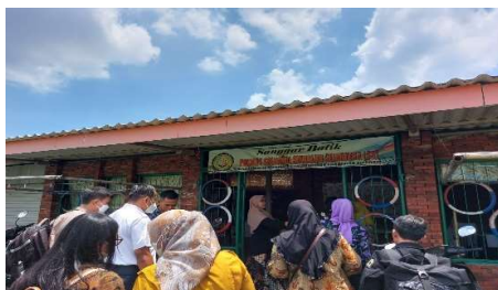
Gambar 3. Unit Usaha Batik BUM Desa Suwaluh Mandiri Sejahtetrah