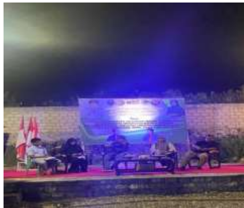
Gambar 2. Dokumentasi Sosialisasi bersama Kepala Desa Walando

Pelaksanaan pengabdian dilakukan dengan dua tahapan, yang mana tahap pertama merupakan tahap persiapan. Pada tahap ini kelompok PKM-PM melakukan survey lapangan untuk melihat kondisi yang ada di Desa Walando kecamatan Gu kabupaten Buton Tengah Provinsi Sulawesi Tenggara. dalam tahap ini Tim PKM menggali promblematika yang dihadapi oleh masyarakat dalam maraknya kasus kekerasan, pelecehan seksual, dan minuman keras di desa walando.