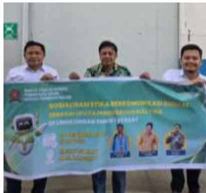
Gambar 3. Mahasiswa yang melaksanakan PKM

Menampilkan tim mahasiswa PKM sekolah setelah pelaksanaan kegiatan sosialisasi, dapat dilihat dari Gambar 3.