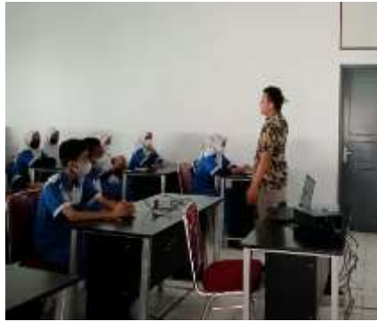
Gambar 2. Hari Kedua Sosialisasi

Menampilkan tim mahasiswa PKM sekolah setelah pelaksanaan kegiatan sosialisasi, dapat dilihat dari Gambar 3.