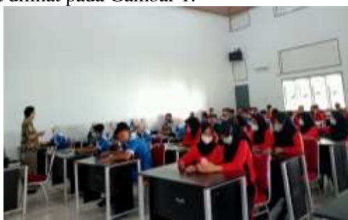
Gambar 1. Hari Pertama Sosialisasi

Hasil dari sosialisasi di komentasikan menunjukkan pelaksanaan kegiatan sosialisasi pada hari pertama, di mana siswa-siswi SMKN 1 Stabat mengikuti pemaparan materi mengenai etika berkomunikasi digital. Pada tahap ini, peserta diberikan pemahaman dasar tentang penggunaan media digital secara bijak serta pengenalan bentuk-bentuk bullying dan cyberbullying yang sering terjadi di lingkungan sekolah. Antusiasme peserta terlihat dari keaktifan siswa dalam memperhatikan materi dan mengikuti sesi diskusi. , dapat dilihat pada Gambar 1.