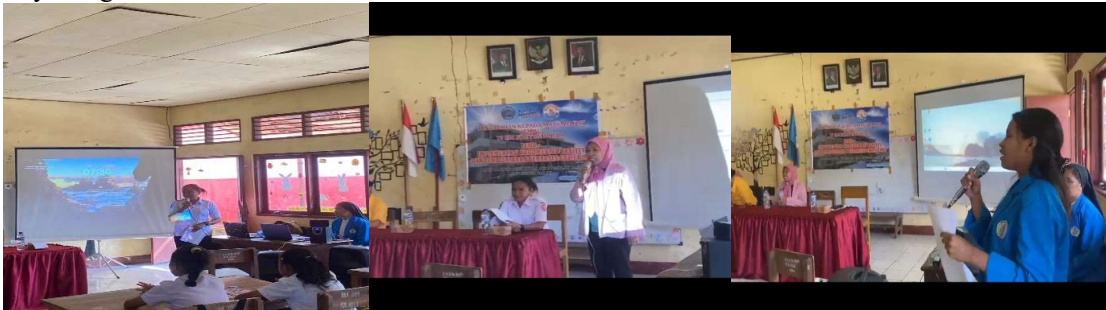
Gambar 1. Pembukaan Kegiatan

Selain itu, pendekatan GBL juga memberikan umpan balik langsung kepada siswa, sehingga mereka dapat mengetahui kesalahan dan memperbaiki pemahamannya secara mandiri. Karakteristik ini sangat sesuai dengan kebutuhan siswa SD yang membutuhkan pembelajaran interaktif dan menyenangkan.