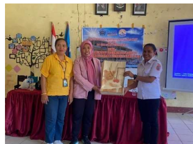
Gambar 4. Penyerahan Cenderamata