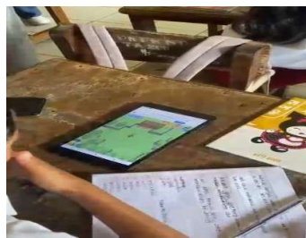
Gambar 2. Permainan Game