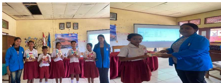
Gambar 3. Penyerahan Hadia