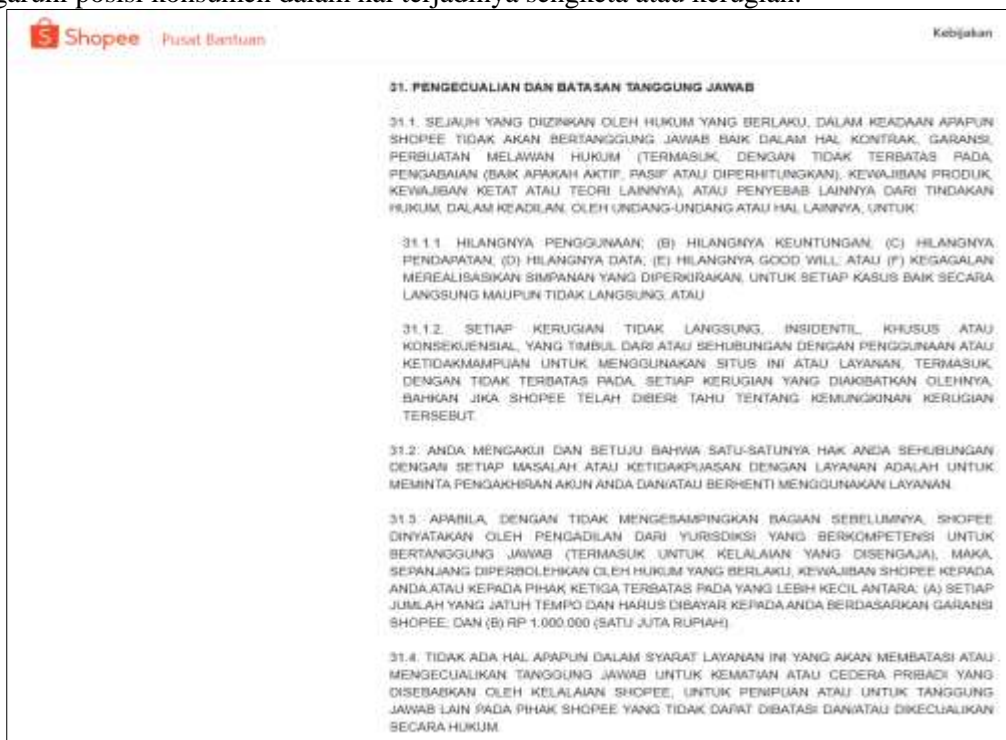
Gambar 2. Klausula Pembatasan Tanggung Jawab Shopee

Selain itu, hasil penelusuran terhadap dokumen Terms of Service Shopee juga mengindikasikan adanya klausula pembatasan tanggung jawab (limitation of liability clause), yang secara hukum dapat memengaruhi posisi konsumen dalam hal terjadinya sengketa atau kerugian.