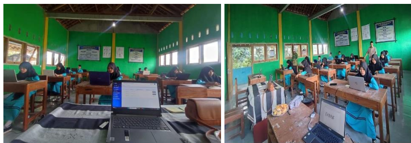
Gambar 1. Dokumentasi Kegiatan

Pohon harapan dapat memberikan informasi tentang harapan santri/wati lingkungan pondok pesantren Mukhtarul Amin NWDI Rensing Bat tentang pengembangan potensi program berbahasa Inggris yang optimal. Pengembangan yang mereka harapkan seperti adanya kegiatan coaching atau workshop secara berkelanjutan tentang pengembangan usaha kuliner dan kegiatan pendampingan berbahasa Inggris secara kontinue. Pihak pondok pesantren masih memiliki semangat perubahan menjadi pondok pesantren tauladan dan sesuai zaman. Mereka berharap dengan mengikuti kegiatan-kegiatan pembinaan dapat membuat mereka menjadi memiliki pengetahuan dan keterampilan mengembangkan potensi program berbahasa Inggris yang maju dengan metode pembelajaran yang terintegrasi dengan teknologi sehingga dapat berdampak secara nyata untuk lifeskill santri/wati kedepannya.