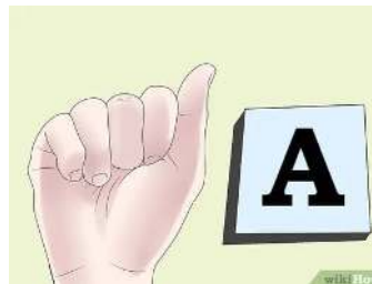
Gambar 1. Abjad A