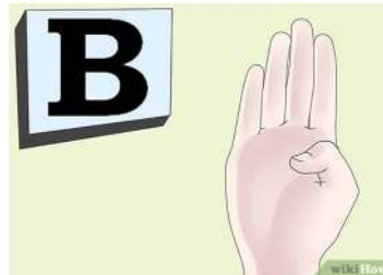
Gambar 2. Abjad B