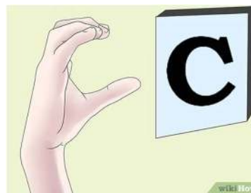
Gambar 3. Abjad C