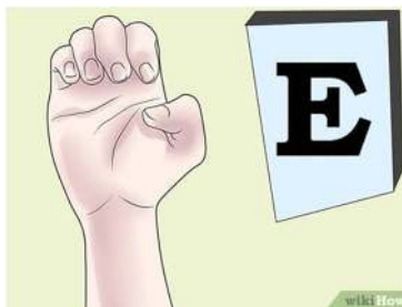
Gambar 5. Abjad E