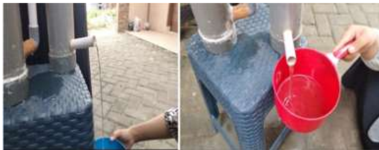
Gambar 1. Hasil Air Bersih