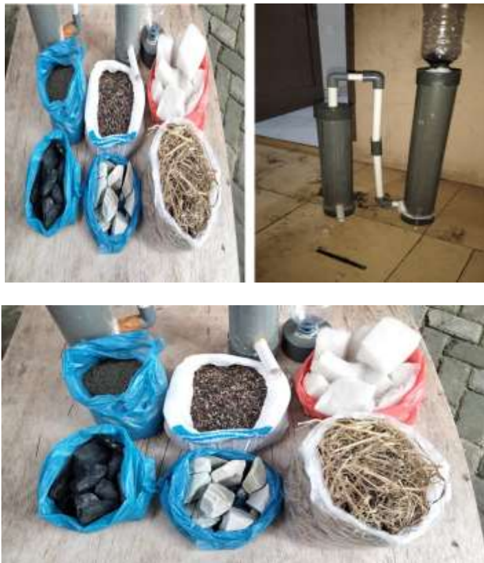
Gambar: Alat Filtrasi sederhana

Alat filtrasi air disusun menggunakan pipa PVC dan botol plastik sebagai wadah utama, dengan media filtrasi berupa jerami, arang sekam padi, karbon aktif, pasir silika, kerikil zeolit, dan spons Aquadine. Susunan media disesuaikan dengan fungsi masing masing bahan untuk menyaring partikel kasar, partikel halus, serta menyerap zat pencemar. Rangkaian alat filtrasi yang digunakan dalam penelitian ini ditunjukkan pada Gambar diatas.