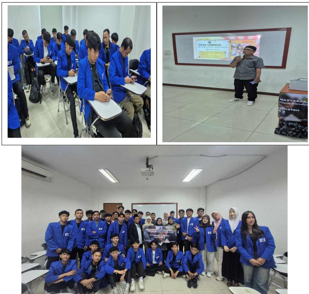
Gambar 5. Sesi Foto Bersama Pemateri

Kesimpulan Secara keseluruhan, integrasi nilai-nilai luhur Ki Hajar Dewantara ke dalam isu kesehatan mental modern terbukti menjadi strategi yang efektif di Universitas Pelita Bangsa. Mahasiswa tidak hanya mengalami peningkatan pengetahuan secara kuantitatif, tetapi juga mengalami transformasi kualitatif dalam memahami peran strategis Tri-Pusat Pendidikan. Sinergi antara pemahaman teoritis dan peningkatan skor evaluasi ini menjamin terbentuknya agen perubahan ( change agents ) di kalangan mahasiswa yang siap membangun ekosistem kampus yang aman, suportif, dan bebas dari perundungan.