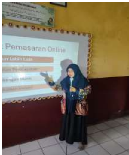
Gambar 3. Pemaparan Materi