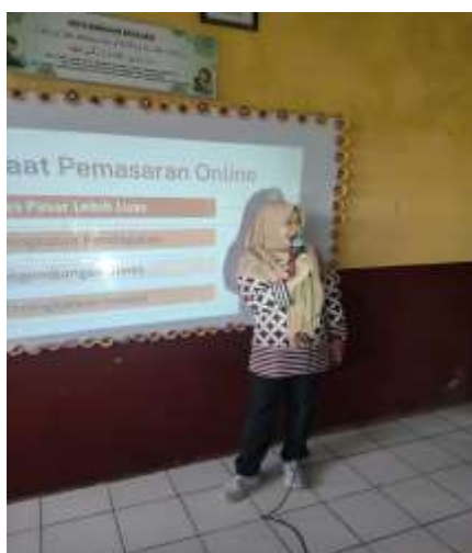
Gambar 5. Pemaparan Materi