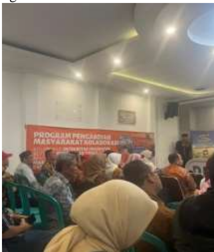
Gambar 1. Pembukaan Acara Di Aula

Secara keseluruhan, hasil pengabdian ini membuktikan bahwa pelatihan layanan wisata yang melibatkan kelompok perempuan mampu memperkuat kapasitas desa menuju desa wisata unggul yang ramah. Foto kegiatan terdiri dari :