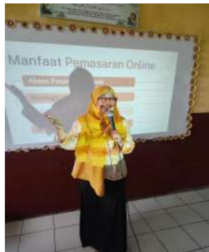
Gambar 4. Pemaparan Materi