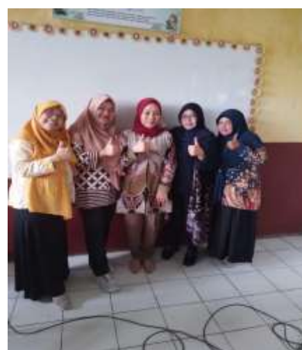
Gambar 6. Foto Bersama Bu Lurah