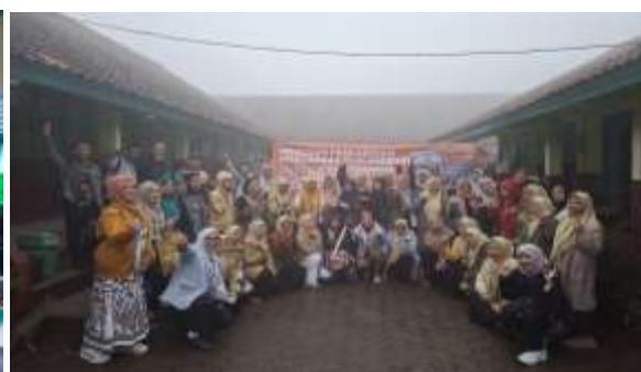
Gambar 7. Foto Bersama Peserta PKM