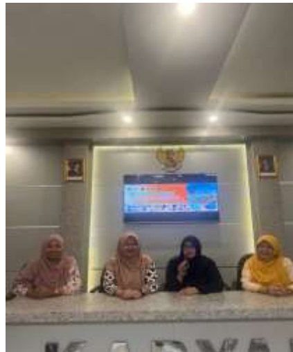
Gambar 2. Pembukaan Acara Di Aula